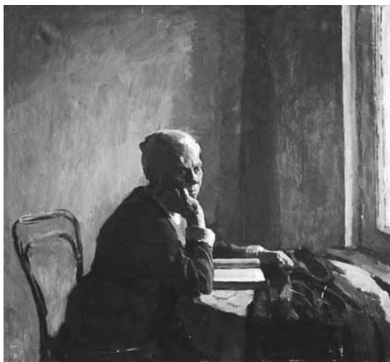
«Одиночество». Автор – студент 4-го курса

На протяжении всего периода существования Художественного факультета тема Великой Отечественной войны всегда находила свое отражение в учебном процессе. Тематика жанровых постановок, курсовых и дипломных работ постоянно посвящается этому важнейшему периоду истории нашей Родины.