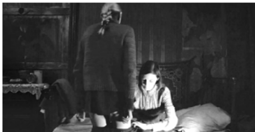
Кадр из фильма «Дылда», 2019 (режиссер Кантемир Балагов, автор сценария Александр Терехов)

Но если речь идет о трагическом событии, о гибели ребенка в неотвратимых обстоятельствах, возможно временная форма фильма содержит время сакральное? Оно возникает, когда происходит преобразование души персонажа. Но сакрального времени в фильме нет — в повествовании не будет ни озарения, ни упования, ни раскаяния. Циклическое время, с его способ-