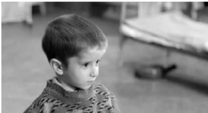
Кадр из фильма «Дылда», 2019

ле картины красному и зеленому надо оказаться рядом, создав глубокий и драматичный аккорд контрастных цветов. В такой художественно-выразительной системе можно забыть и об убитом мальчике, но нельзя не надеть на него красный свитерок.