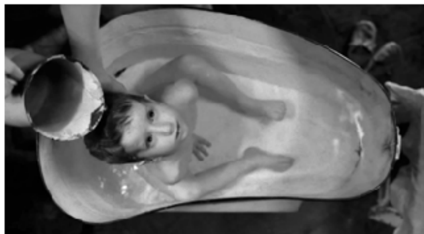
Кадр из фильма «Дылда», 2019

ма. В этом обнажении уже нет того, что можно было бы назвать эротизмом или интимностью. Зато есть акцент на слабости, нежности и болезненности, травмированности тела. Именно в бане Ия видит на теле Маши шрам от осколочного ранения.