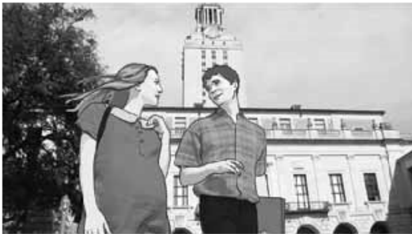
«Башня», 2016. К. Мэйтленд

истории о людях или исторических событиях, мы не можем воспринимать их как нереальные, вымышленные только потому, что они представлены в графической форме и созданы аниматорами. Рисованные образы в лентах «Башня» (2016, К. Мэйтленд), «Крулик: