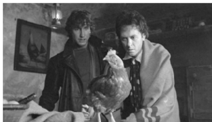
Кадр из фильма «Уитнейл и Я», 1986, режиссер Брюс Робинсон

обыденной для них стала богемная реальность Лондона конца 60-х годов XX века. Пускаясь в это путешествие, они отправляются в древовидный лабиринт, разветвляющийся на два обособленных пространства: Лондон и сельская мест-