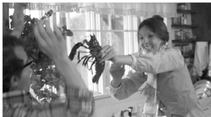
Кадр из фильма «Annie Hall», 1977, режиссер Вуди Аллен

Есть еще ряд фильмов, являющихся усложненными комедиями, снискавших любовь как зрителей, так и критиков. Это ленты Вуди Аллена «Annie Hall» (1977) и «Manhattan» (1979), вторым сценаристом которых