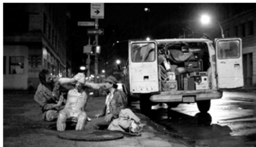
Кадр из фильма «After hours», 1985, режиссер Мартин Скорсезе

6 Эко У. От древа к лабиринту. М: Академический проект, 2016. С. 53.