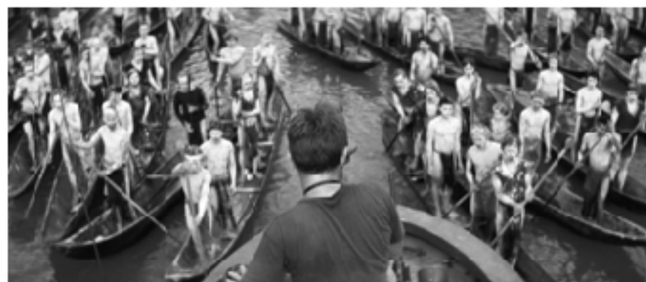
Кадр из фильма «Апокалипсис сегодня», 1979, режиссер Френсис Форд Коппола

намской кампании обратно к безвременной архаике, где в центральной комнате капитану Уилларду придется столкнуться с Минотавром в лице полковника Курца. Но что