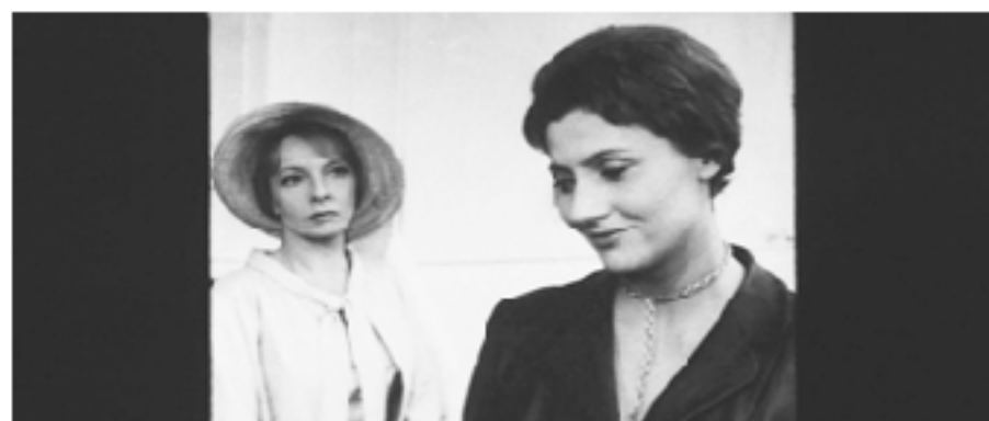
Сцена встречи Лизы и Марты после войны на лайнере. Фильм «Пассажиры» (режиссер Анджей Мунк, 1962)

драматургии интересных характеров в проявлениях их бинарных реакций. Фашистская тоталитарная машина превратила героиню-палача в орудие подавления отверженных через их унижение