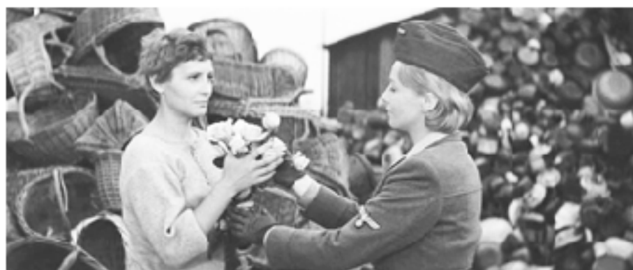
Героиня-эсэсовка Лиза с узницей Мартой в концлагере, фильм «Пассажиры» (режиссер Анджей Мунк, 1962)

на этот раз самой себе, нельзя назвать исповедью. Не бывает исповеди без признания вины, без покаяния. Это суть рефлексии героини на прошлое в попытке себя оправдать.