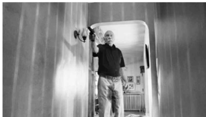
Сцена самозащиты главного героя. Фильм «Помнить» (режиссер Атом Эгоян, 2015)

Перемещения почти 90-летнего старика по стране, за ее пределы, в Канаду, — неимоверно трудны, и это вызывает сочувственное отношение у зрителя к Зеву. Герою предстоит встретиться с четырьмя людьми с одинаковыми именами Руди Курландер и вычислить среди них искомого нациста, оберфюрера Отто Валиша из Аушвица. Парадокс заключается в том, что именно наш герой Зев и есть в действительности тот самый человек, который преследует, по сути, самого себя — бывшего преступника-нациста. Но пока ни зритель, ни герой не предполагают такого разворота событий. Первые два Руди Курландера из списка — это дрях-