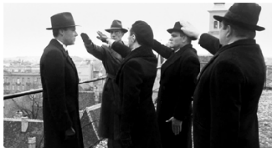
Сцена встречи Макса на крыше с бывшими нацистами. Фильм «Ночной портье» (режиссер Лилиана Кавани, 1974)

форму, не вызывает сомнений. В этом конкретном примере много потаенных мотивов, свойственных как индивидуальной психологии, так и психологии общества. Налицо нездоровое тяготение Люции к символам власти, мужской brutality Макса, на-