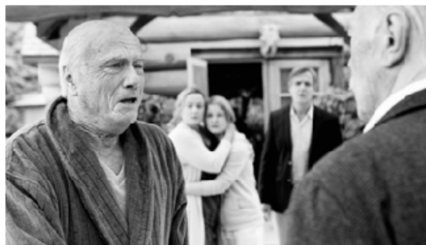
Финальная сцена раскрытия тайны. Фильм «Помнить» (режиссер Атом Эгони, 2015)

кардинальное внутреннее преобразование, метаморфоза палача, который стал идентифицировать себя с бывшим узником концлагеря. Его состояние можно расценивать как результат душевной болезни, которая развилась в нем от страха и ужаса мас-