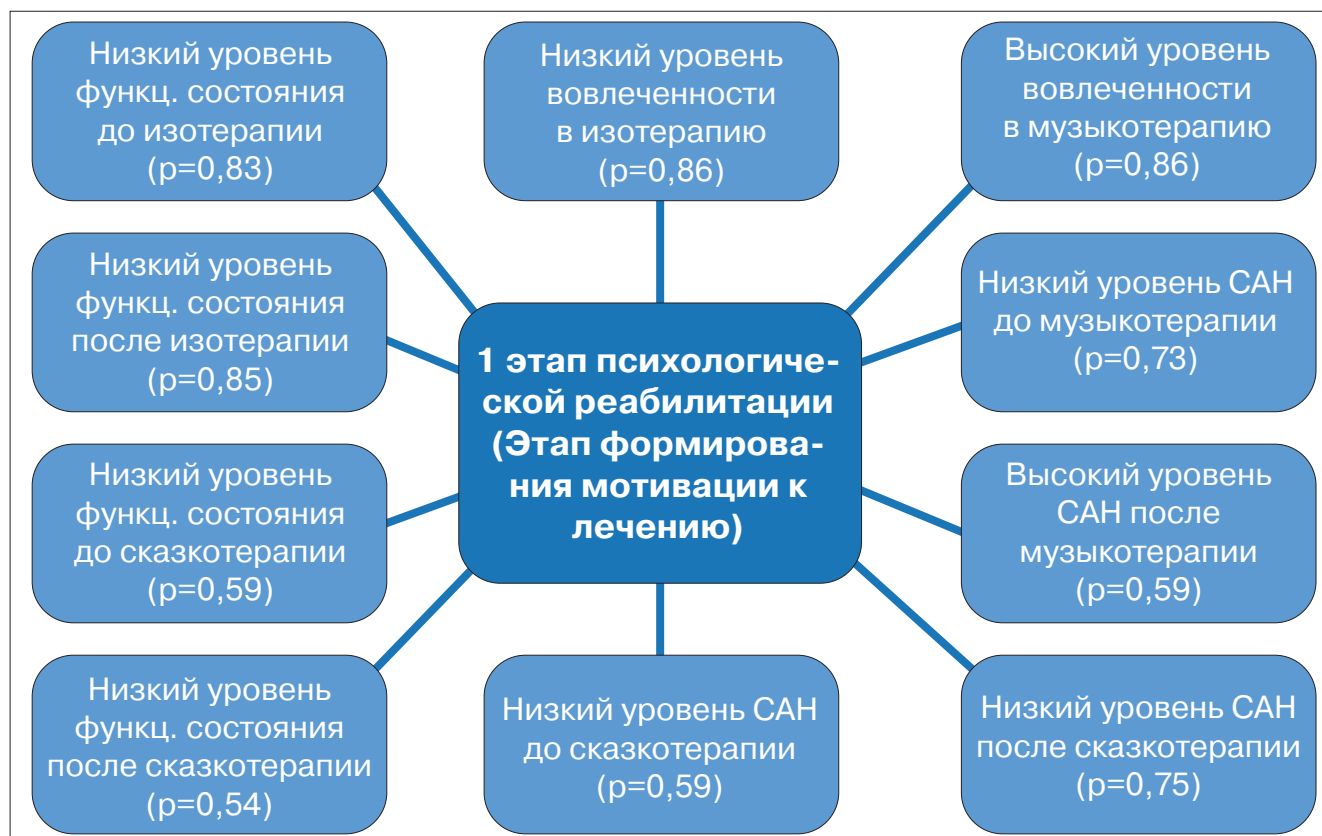
Рис. 1. Результаты корреляционного анализа использования различных методов арт-терапии на 1 этапе психологической реабилитации ( p < 0,05 ).