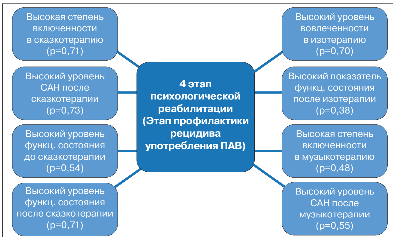
Рис. 4. Результаты корреляционного анализа использования различных методов арт-терапии на 4 этапе психологической реабилитации ( p < 0,05 ).

Анализируя данные по второй исследовательской группе, находящейся на втором подэтапе психологической реабилитации (этап решения внутренних психологических проблем), стоит отметить, что по-прежнему сохраняется низкий уровень вовлеченности в занятия по сказкотерапии, однако возрастает интерес к занятиям по изотерапии, что подтверждается изменением психофизиологических показателей функционального состояния пациента после занятий по изотерапии (Рис. 2). В результате чего, можно предположить, что на данном этапе реабилитации,