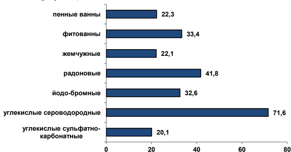
Рисунок 1 - Структура бальнео- и гидропроцедур в восстановительном лечении на базе военного санатория г. Пятигорска, %

Бальнеолечение лиц, пострадавших в чрезвычайных ситуациях включает 3-х разовый прием минеральной воды, различные ванны, гидро- и грязевые процедуры. Санаторно-курортным больным назначается семь видов ванн (рисунок 1).