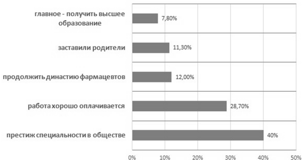
Рисунок 2 – Факторы влияния на выбор профессии

Следующий вопрос был направлен на определение сформированной профессиональной стойкости: "Представьте, что Вы опять абитуриент и намереваетесь поступить в вуз. Избрали ли бы Вы профессию, которой овладеваете теперь?" Ответы на этот вопрос показывают, насколько сознательным был выбор профессии. Стойкость профессионального вы-