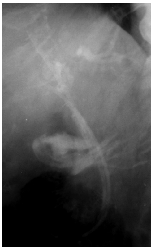
Рис. 1. На рентгенограмме слева определяется параллельное проведение дополнительного стента. На рентгенограмме справа определяется дренирование желчных протоков двумя эндопротезами с постепенным опоружением внутрипечёночных протоков