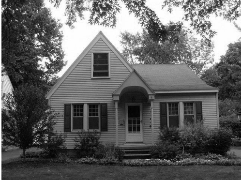
Рис.1. Дом "Тюдор" (House "Tudor")

сти отреставрировать собственный дом в черте города (было невозможно получить ипотечный кредит на «старый» дом), с радостью приняли предложения застройщиков и государства о переезде в собственный дом в пригороде. Началом