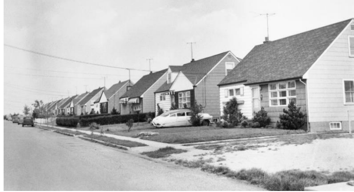
Рис.2. Дома "CapeCod" (Homes "CapeCod")

строительства пригородов Америки можно считать 1929 год, когда на свет появился первый дом "Тюдор" компании "Левитт и сыновья" (рис.1, 2).