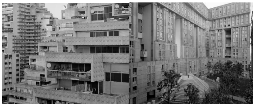
Рис. 4. "Большие ансамбли", начало 1950-х годов, Париж ("Big ensembles", the beginning of the 1950s, Paris).

Франция. Район "Большие ансамбли" стали строить под Парижем в начале 1950-х годов, почти сразу после Второй мировой войны, чтобы справиться с проблемой жилищного кризиса. Через несколько лет, после заселения многие жильцы покинули новостройки из-за отсутствия рабочих мест рядом с домом (рис. 4).