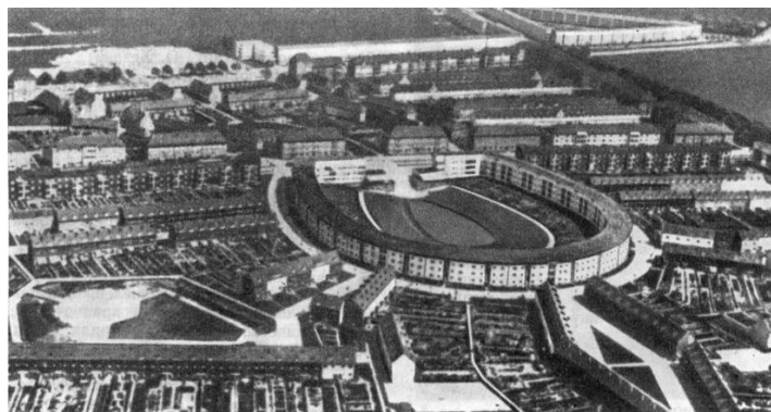
Рис. 3. Жилой массив, 1924—1926 гг. Архитектор О. Хезлер.