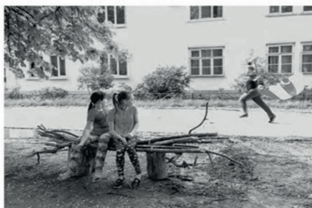
Рис. 2. Инструменты детского соучаствующего проектирования в ходе проведения фестиваля «Арт-овраг»