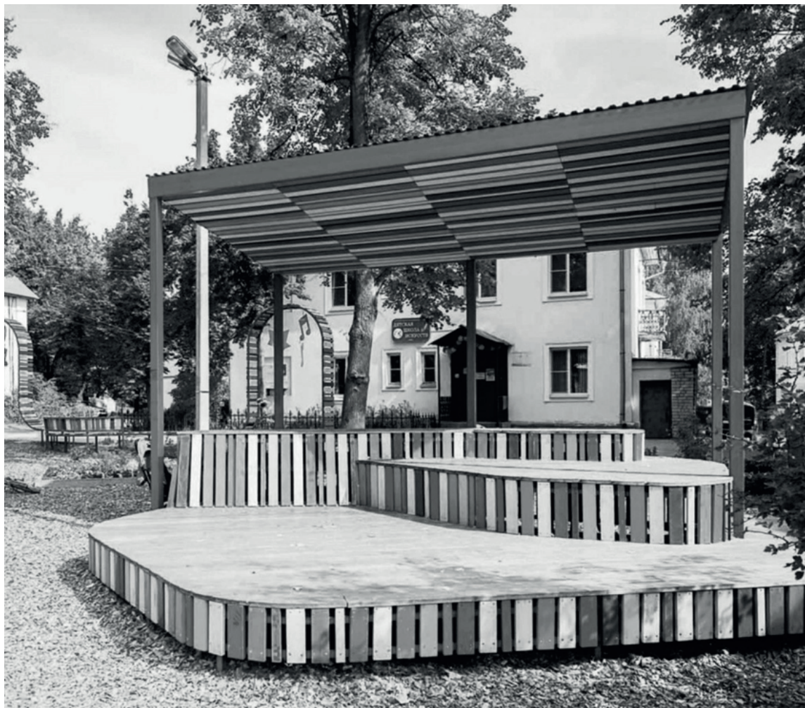
Рис. 3. Проект благоустройства дворовой территории, г. Выкса, ул. Пирогова, 6

4. Обсуждение и символическое закрепление за пользователями конфликтных территорий там, где возможен компромисс. Выработка ответственных решений (с пониманием того, кому и зачем они нужны, как они будут существовать дальше после реализации проекта). В случае невозможности договора, необходимо провести реорганизацию пространства и наделение его новой функцией. Часть конфликтов находится в социальной и юридической сфере, решить их можно только внутри сообщества (формированием социальных норм, культуры общения и взаимодействия в данном дворе).