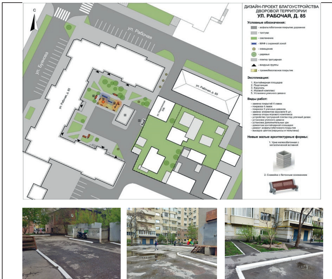
Рис. 1. Проект благоустройства дворовой территории, Самара, ул. Рабочая, 85, муниципальная программа «Формирование комфортной городской среды»

Также при поддержке Фонда президентских грантов преподавателями и наставниками социального проекта был представлен сборник методических рекомендаций, в котором были изложены основные этапы устойчивого развития дворовых территорий: