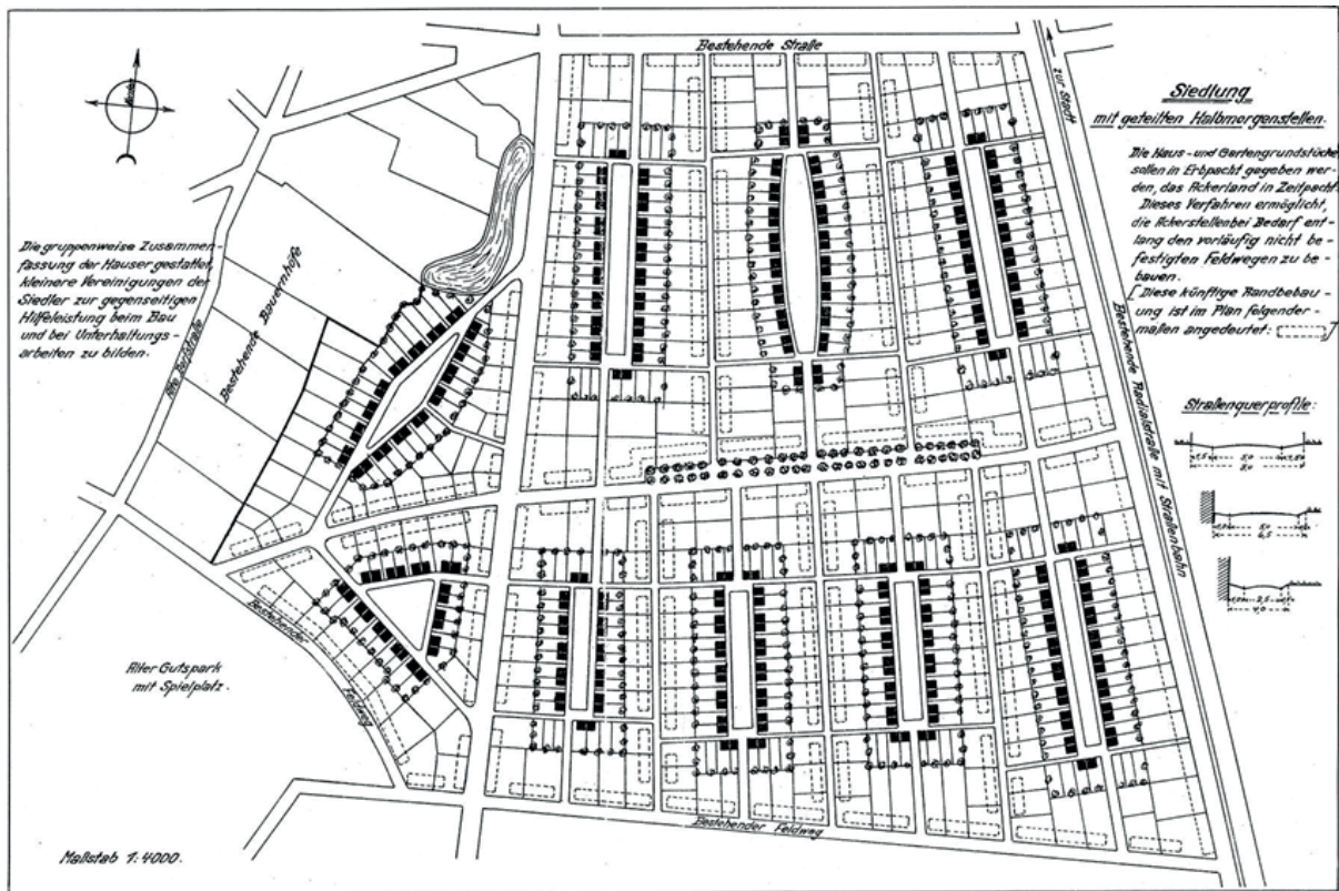
Рис. 3. Роман Хайлигенталь. Планировка пригородного поселения под Берлином [13]

также и в других странах европейской цивилизации.