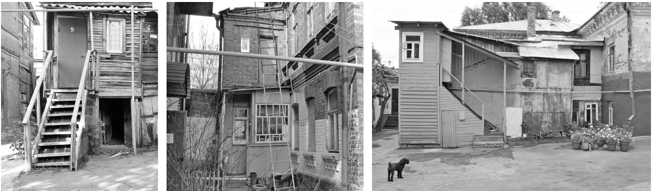
Рис. 2. Объекты спонтанного развития в исторической среде Самары

Объекты спонтанного развития двора (рис. 2) помимо исторического отражают время как персональные истории жизни его обитателей. Через спонтанную архи-