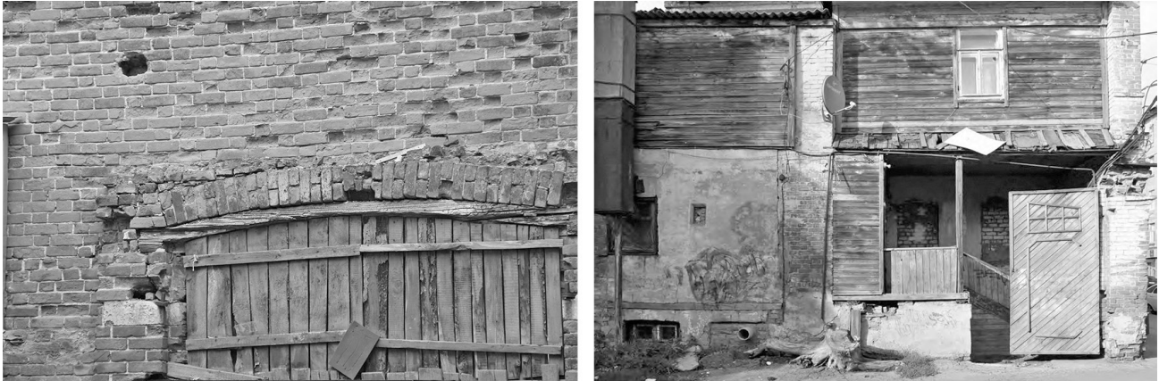
Рис. 3. Фактуры в исторической среде Самары

тектуру обитатели двора воплощают своё присутствие в этом мире. Эти объекты формируют личную причастность к окружению, представляя собой отпечатки личности его обитателей. К. Линч подчеркивает гуманность этой особенности человеческого окружения фиксировать недавние события, позволяющей людям отмечать собственный жизненный путь. «Эта черта кажется человеческой не только для обитателя, но и для постороннего наблюдателя, который ощущает теплоту окружения и через него устанавливает символические связи с обитателями», - пишет К. Линч [1, с. 162].