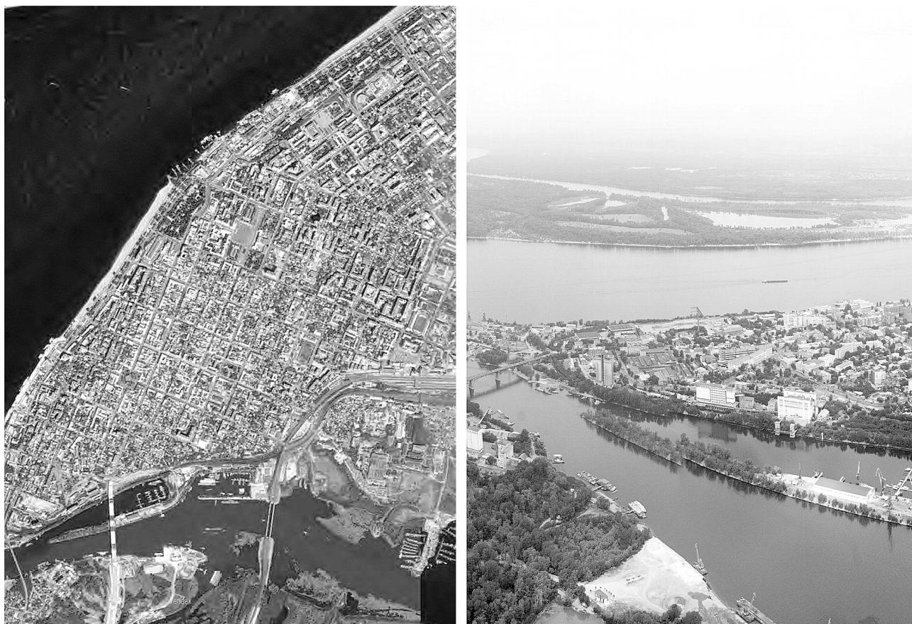
Рис. 4. Историческая часть Самары с высоты птичьего полёта

ния, в пульсации движения людей, обусловленной трудовым ритмом [5].