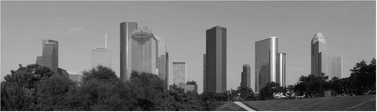
Рис.3. Панорама делового центра Хьюстона