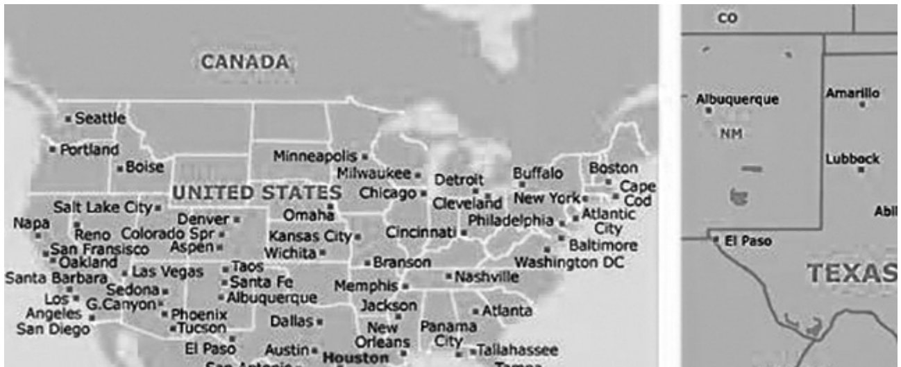
Рис.1. Схема мегаполисов США. Схема городов штата Техас