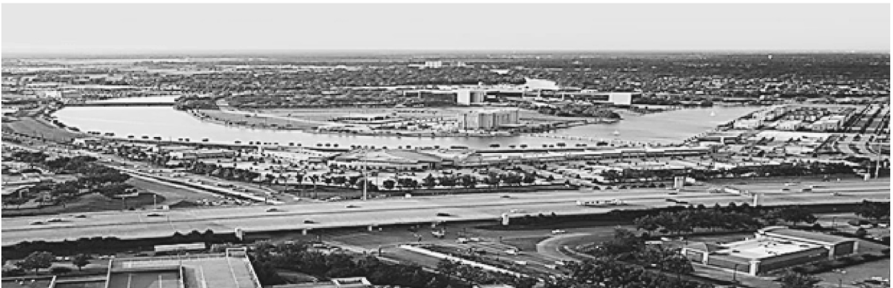
Рис.4. Панорама Шугар-Ленда – пригорода Хьюстона

стремительно, что было связано с градостроительной политикой того времени. Ускоренная урбанизация, развернувшаяся с 1930-х гг., привлекавшая население в города и выталкивавшая жителей из деревень, способствовала стремительному росту новых городов-миллионеров, помимо Москвы и Санкт-Петербурга. Поэтому сейчас многие отечественные мегаполисы переживают стадию, которую передовые глобальные города прошли 30-40 лет назад. Следовательно, необходимо учесть удачные и неудачные методы развития мегаполисов, факторы их реализации и проблемы, с которыми они столкнулись, для выбора эффективной стратегии развития отечественных городов [15].