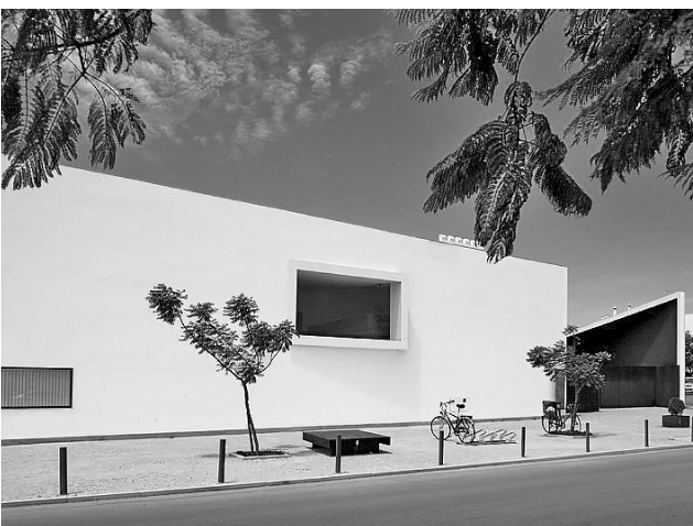
Рис. 14. Жоао Луис Каррильо Да Граса. Публичная библиотека, Тавира, Португалия, 2001

архитектурной манифестации. Архитектор говорит, что «аскеза позволяет человеку очертить границы необходимого. Понимание рождается благодаря погружению внутрь себя, структурированию своей жизни в соответствии с этими ощущениями, а не в результате подчинения господствующему мнению» [10]. Выход, который предлагает Аурели, заключается в том, чтобы через аскезу очиститься от всего ненужного, излишнего, избыточного и установить в определенном смысле пределы архитектуры, которые позволяют ей оставаться таковой, не переходя к упрощенчеству и не теряя сущность искусства архитектуры: «Аскетизм, таким образом, это возможность вернуть себе хорошую жизнь и вместе с ней надежду, что мы можем жить – и жить лучше – довольствуясь меньшим... когда мы сможем избавиться от этой идеологической нагрузки, «меньше» может стать стартовой точкой альтернативного образа жизни, независимого от ложных нужд рынка... говорить, что «меньше – это достаточно» – значит не поддаваться