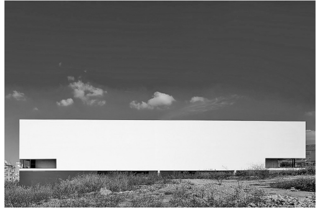
Рис. 13. Жоао Луис Каррильо Да Граса. Школа музыки, Лиссабон, Португалия, 2008

дыхание жизни, которое в случае симметрии сделало бы их объектами тяжеловесными, знаковыми и грубыми. Как у Греготти: «В простоте не должно быть ничего предустановленного, ничего неподвижного. Вместо этого все должно быть сбалансированным, соразмерным, осуществляя взаимоотношения между моментами, витальной организацией, загадочной прозрачностью» [6].