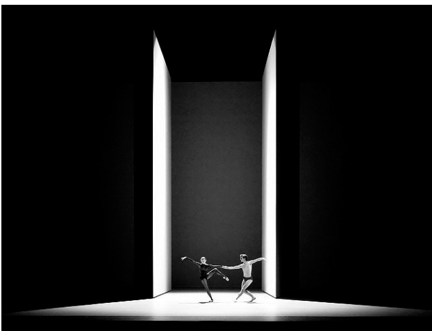
Рис. 2. Джон Поусон. Сценография спектакля L'Anatomie de la Sensation , Опера Бастилия, Париж, 2011 [7]

Не случайно, одним из первых авторов этой архитектуры является англичанин Джон Поусон, автор «Минимума», в котором он определил свои архитектурные приоритеты: «серии пространственных тем массы, структуры, ритуала, ландшафта, ордера, сдерживания, повторения, объема,