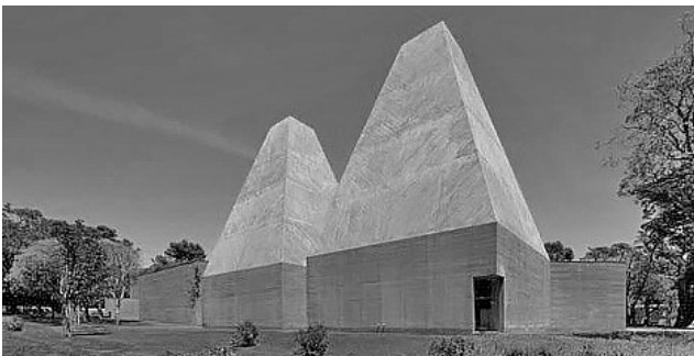
Рис. 10. Эдуардо Соуто де Моура. Музей Паулы Рего, Кашкайш, Португалия, 2009 (archdaily.com)

Швейцарцы Аннет Гигон и Майк Гайер, кажется, нашли этот способ выражения – без жестов, без слов, без значений. В их объектах – жилых комплексах, частных виллах, административных зданиях нет намеренной эстетики, как в работах их всемирно прославленных соотечественников, и именно этим отсутствием их архитектура и привлекает внимание. На грани с аскетизмом, эта архитектура работает на нюансе – расположение окон, легкое движение объемов, поворот, цвет или погружение в природный контекст вплоть до растворения, – она следует природе мимолетности, естественной подвижности форм, которая ни в коем случае не выходит за рамки устойчивости, но наоборот, кажется, подтверждает надежность зданий тем, что эта подвижность заложена в основе самой тектоники. Все среднее, умеренное и соразмерное – этажность, движение, материал, – все moderato и andante , если перевести их архитектуру на язык музыкальных темпов. Все спокойно, равномерно, но никогда не скучно – потому что действительно музыкально. Повседневность? – да, рутина? – нет. Скорее осознанное и глубокое проживание жизни с любовью к ее естественным ритуалам и, не закрываясь от мира, сохранение самодостаточности. Подвижность и определяет