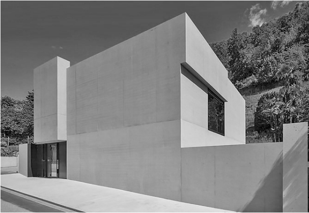
Рис. 4. Аннет Гигон и Майк Гайер. Фонд Маргерит Арп, Локарно, Швейцария, 2014 [8]