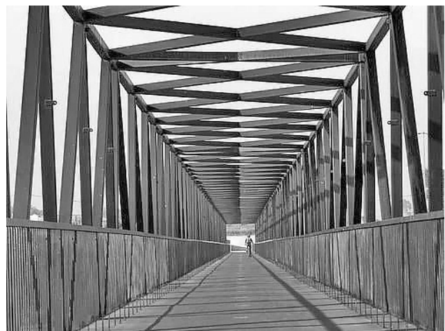
Рис. 15. Жоао Луис Каррильо Да Граса. Пешеходный мост, Виламура, Португалия, 2011