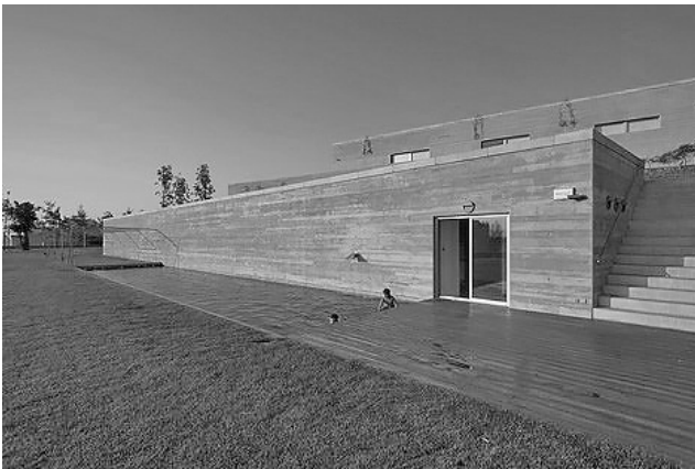
Рис. 8. Эдуардо Соуто де Моура. Дом в Бон-Жезус, Брага, Португалия, 1994