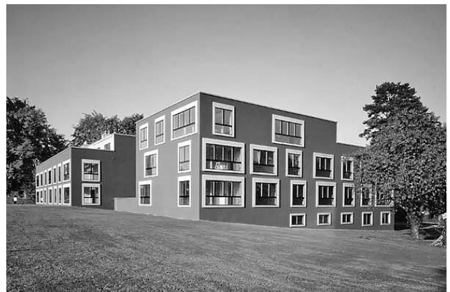
Рис. 7. Аннет Гигон и Майк Гайер. Жилой дом, Кильхберг, Швейцария, 1996 [8]