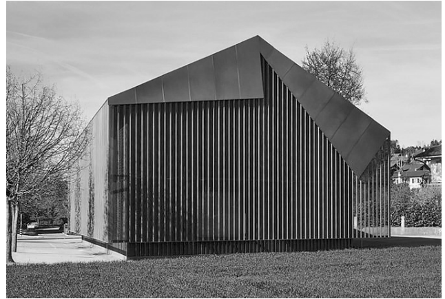
Рис. 5. Аннет Гигон и Майк Гайер. Галерея Хенце и Кеттнер, Вихтрах, Швейцария, 2004 [8]

сущности и выражения» [4]. Островной характер Британии, традиционно сохраняющей свою географическую и ментальную квазиавтономию, выразился во внимании к архитектуре простоты. «Я не был готов, чтобы стать популярным как минималист», – говорит архитектор [5] в ответ на стремление критиков поставить его в рамки искусственных классификаций, трендов и теорий. Все его объекты, разбросанные по миру, – сценография, интерьеры, частные дома – являются иллюстрациями к тексту Греготти: «Простое здание основывается ... на принципе поселения ... включая связь с землей и географией, которая представляет свою историю во всех ее частях и связывает сама себя прямо с принципами собственного синтеза» [6]. Удивительно, насколько точно Поусон обнаруживает эту связь с географией в совершенно различных частях света, выражая это почти неуловимое и все же абсолютно артикулированное качество, ограниченными средствами добиваясь максимума выражения.