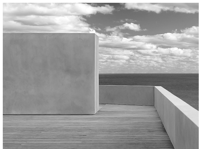
Рис.3. Джон Поусон. Монтаук Хауз , Лонг-Айленд, Нью-Йорк, 2013 [7]