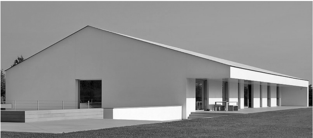
Рис. 1. Джон Поусон. Каза делле Боттере, Тревизо, Италия, 2011 [7]

существует обыкновенная жизнь с ее естественной скоростью, жизнь, которая не стремится быть частью глобального потока, но наоборот противостоит ему своей органичной неспешностью. Эта «негромкая» архитектура ничего не означает и не стремится ничего означать кроме себя самой – архитектуры с ее традиционными качествами и отсутствием какой-либо замысловатости, архитектуры, произрастающей из существующей реальной ситуации и ресурсов – не больше и не меньше. Через определения, географию, типологию можно попытаться очертить это архитектурное поле и взглянуть на общее и особенное в его различных источниках и проявлениях.