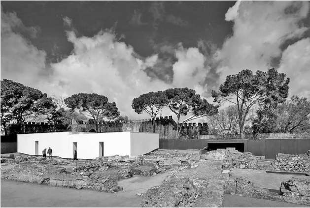
Рис. 12. Жоао Луис Каррильо Да Граса. Археологический участок в Каштелу-де-Сан-Хорхе, Португалия, 2010