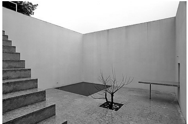
Рис. 9. Эдуардо Соуто де Моура. Дом в Серра-да-Аррабида, Португалия, 2002

историческая плотность абсорбировала все модернистские послевоенные интервенции.