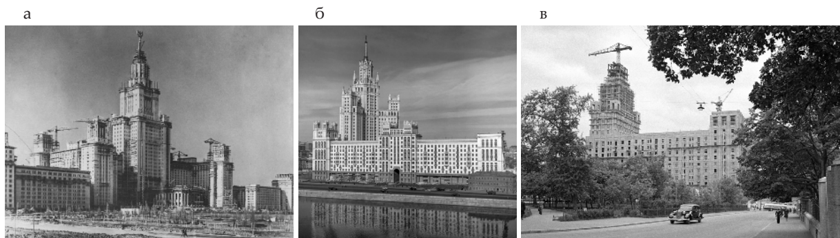
Рис. 4. Высотные здания в Москве: а – строительство здания МГУ, Ленинские горы, 1951 г.; б – высотное здание, Котельническая набережная, 1950 г.; в – высотное здание, пл. Лермонтовская, 1950 г.