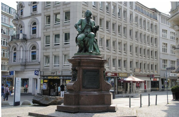
Рис. 2. Памятник Готтольду Эфраиму Лессингу, Будапешт, г. Гамбург, площадь Лессинга

Вслед за Р. Сеннетом британский социолог З. Бауман, профессор Лидского университета Великобритании, в своих теоретических изысканиях также актуализирует проблему соответствия архитектурной среды общественных пространств города в среде публичной культуры, дифференцированной на типы «высокомерных» и «неприветливых» пространств, внутри которых не реализуется культурное взаимодействие людей [19]. В качестве примера он рассматривает знаменитую площадь La Defense в Париже, характеризуя ее как бездушное и лишённое комфорта пространство (рис. 2). Примечательно, что квартал Ла Дефанс является неотъемлемой частью знаменитого «триумфального пути» или, как его еще называют, «историческая ось». Однако никакой интеграции исторического, а значит и культурного контекста в архитектурную среду не происходит. Напротив, мы наблюдаем пространство, в котором неуютно и «пусто», перед нами предстаёт «холодная» площадь, окруженная