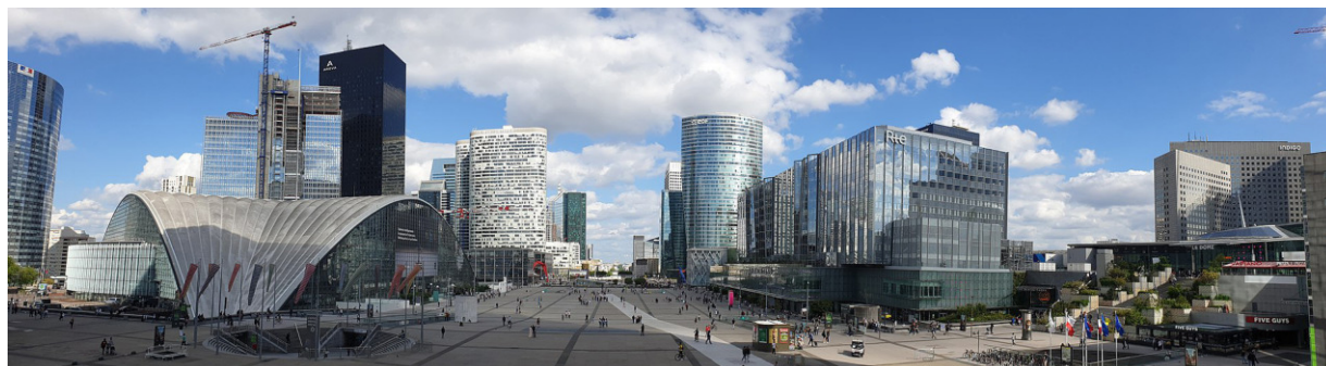
Рис. 3. Площадь Ла Дефанс, Франция, Париж, 2019 г.

Профессор Московского архитектурного университета А.В. Крашенинников подчеркивает, что индивидуальный образ публичных пространств формирует архитектура существующих построек, отражающая национально-культурную компоненту за счет наличия объектов историко-культурного наследия, зна-