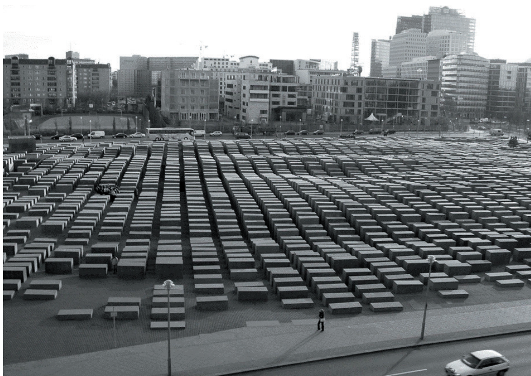
Рис. 4. Мемориал убитым евреям в П. Эйзенмана

ную роль в процессе повышения привлекательности общественных пространств и индивидуализации городского пейзажа. Пейзаж может быть важным элементом визуальной информационной системы, фактором интеграции местного сообщества и способом создания идентичности общественного достояния [13].