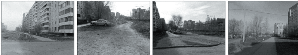
Рис. 2. Концепция формообразования линейного пространства. Самара, ул. Нововокзальная. Авторы: Е.А. Темникова, А.А Темников