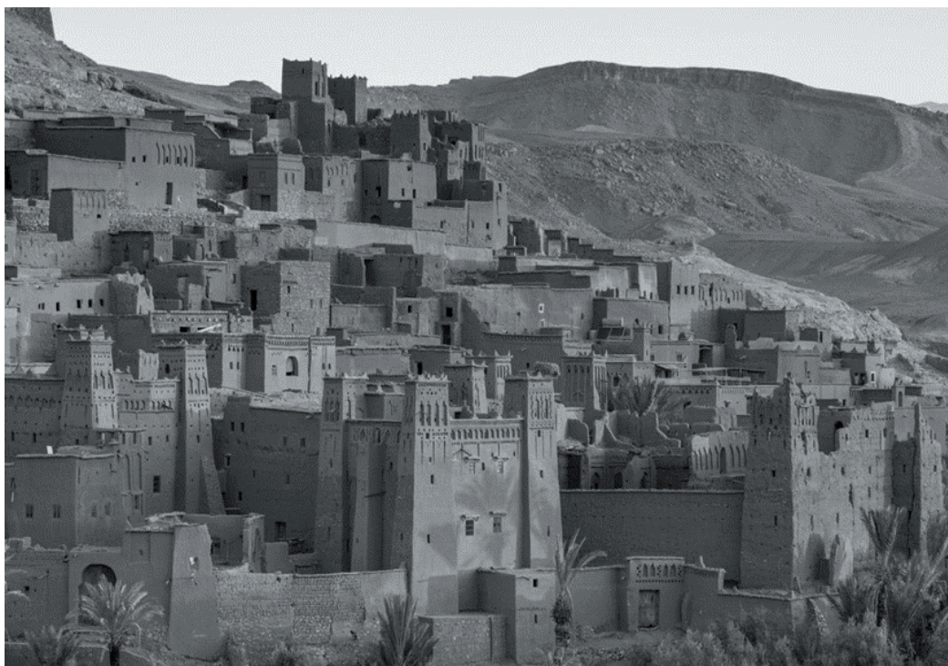
Рис. 3. Айт-Бен-Хаду в Марокко

Рассмотрим, например, значение коммеморативного искусства, которое подчёркивается многими авторами, придаёт городскому пространству некую историческую преемственность и объединяет местные сообщества. Скульптурная архитектура некоторых памятников и мемориалов, таких как Музей Холокоста Д. Либескинда и Мемориал убитым евреям в П. Эйзенмана, расплывшихся в Берлине – некогда столице нацизма, – являются всемирным символом коллективной памяти (рис. 4).