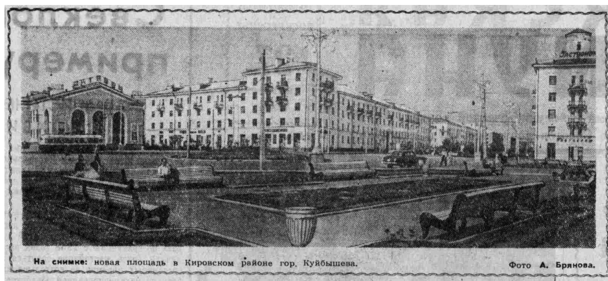
Рис. 5. Застройка площади Металлургов, 1959 [13]