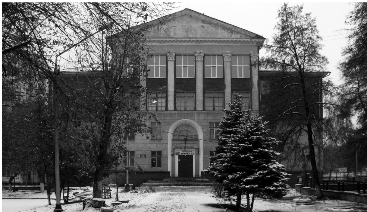
Рис. 7. Школа № 150, ул. Республиканская, 50 (типовой проект), 1958

К концу августа 1959 г. ансамбль площади Мочалова сформировался полностью. Вот что писал об этом архитектурном ансамбле самарский архитектор А.Г. Моргун: «Удачно складывалась застройка трапециевидной площади Metallургов, на которой в окружении добротных угловых зданий с башенными завершениями открыли Дворец культуры на 800 мест. Для его строительства использовали типовой проект, а отделку интерьеров осуществили местные архитекторы и скульпторы. Вместе с построенным напротив кинотеатром «Октябрь», вход в который подчеркивает строчная арочная лоджия, новый Дворец занял господствующее положение в ансамбле просторной площади и удачно вписался в озелененный сквер. Строгий восьмиколонный портик и две многофигурные скульптурные композиции придали ему черты монументальности».