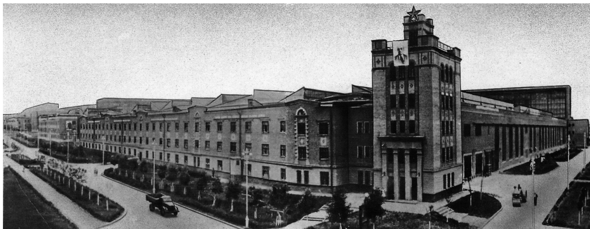
Рис. 2. Куйбышевский металлургический завод