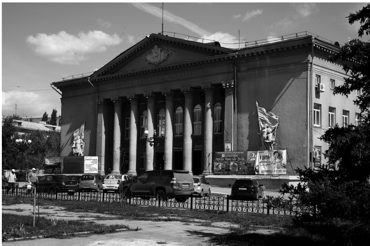
Рис. 8. Дворец культуры Metallургов, пр. Metallургов, 75, архитектор К. Барташевич, 1956–1959

Вывод. История строительства рабочего поселка при металлургическом комбинате была в значительной степени историей противостояния городских властей, стремившихся силами мощественного ведомства решить задачу строительства социалистического города Куйбышева в границах основного пятна застройки Старого города, и руководства металлургического завода, сосредоточившего в своих руках огромные финансовые ресурсы, собственный строительный трест и средства на капитальное строительство, реализовавшего задачу создания собственного рабочего поселка при предприятии, что позволило закрепить в непосредственной близости от предприятия рабочую силу [18]. В результате был построен рабочий поселок при металлургическом заводе, архитектурно-планировочная организация застройки которого отвечала господствовавшим в 1950-е гг. принципам – созданию укрупненных жилых кварталов с внутренними дворами, обслуживанию населения объектами социально-бытового назначения в радиусе пешеходной доступности – детскими садами, школами, поликлиниками, домами культуры и другими, организации главной магистрали с объектами обслуживания в первых этажах жилых зданий, зелеными курдонерами, связывающими жилую зону с промышленным