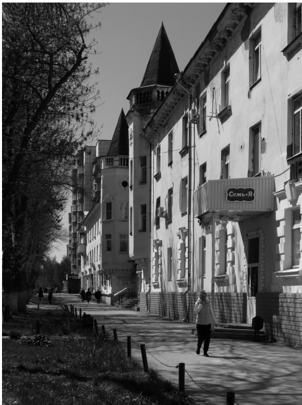
Рис. 4. Общежития на проспекте Металлургов («Итальянские пики»), 74, 76, Гипроавиапром, архитектор Тарасов, 1951–1953

шева по ул. Сталинабадской (пр. Металлургов) строился также для работников завода п/я 630 (Металлургический завод им. Ленина). Проект здания был разработан Куйбышевским филиалом Гипроавиапрома и утвержден заместителем министра авиационной промышленности А.А Зориным 15.05.1952 г. Строительство вело СМУ-3 треста «Металлургстрой». Сооружение здания было начато в мае 1952 г., 31 декабря 1953 г. приемочная комиссия горисполкома подписала акт приемки в эксплуатацию кирпичного 4-этажного жилого дома с размещением в первом этаже магазина. Все здание имеет 6 секций и 53 квартиры [7].