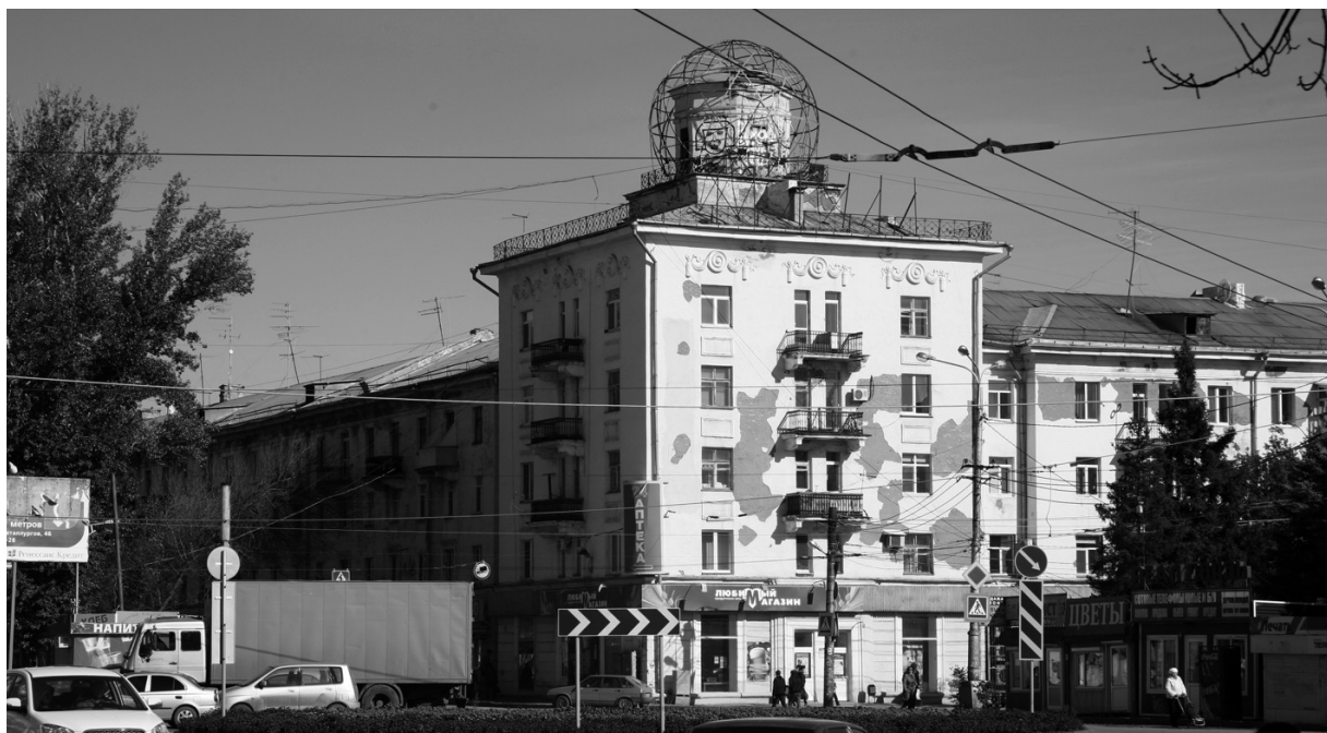
Рис. 6. Жилой дом, пр. Metallургов, 77, Куйбышевский филиал Гипроавиапрома, архитекторы А.А. Тощакон, Н.Б. Кузнецов, 1953–1957

Школа № 150, ул. Республиканская, 50, типовой проект, 1958. Школа была открыта 1 сентября 1958 г. в Кировском районе. Главным фасадом она выходит на ул. Республиканскую, задним фасадом – на ул. Енисейскую. Со стороны главного фасада организован школьный двор. Здание образует в плане букву П, ризалит с главным входом активно выдвинут в сторону двора. Школа имеет четыре этажа. Ризалит главного входа имеет двухчастную структуру. Верхние два этажа оформлены портиком с шестью коринфскими пилястрами. Входную композицию завершает треугольный фронтон. Здание построено из красного кирпича без отделки штукатуркой, что объясняется курсом на экономию строительства. Главный вход имеет обрамление в виде портала, между пилястрами размещены барельефы (рис. 7).