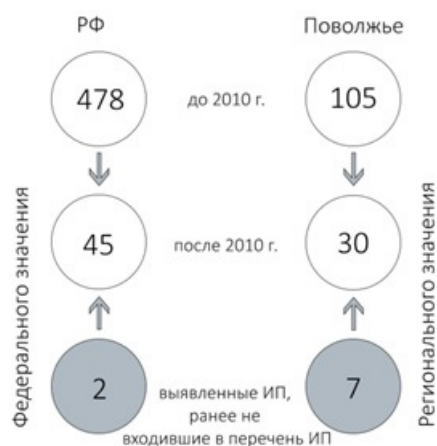
Рис. 1. Динамика изменения количества исторических поселений в Поволжье и РФ в целом

Министерством культуры Российской Федерации разработана Концепция по развитию исторических поселений, поддержке и популяризации культурных и туристских возможностей, развитию экономики культурного наследия на период до 2030 года (далее – Концепция).