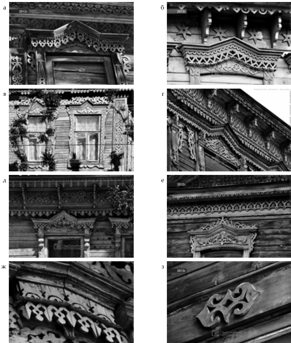
Рис. 2. Растительные мотивы и загадочные рожаницы на самарских окнах (фото Н. Масловой с сайта samara.vsedomarossii.ru\alboms ):