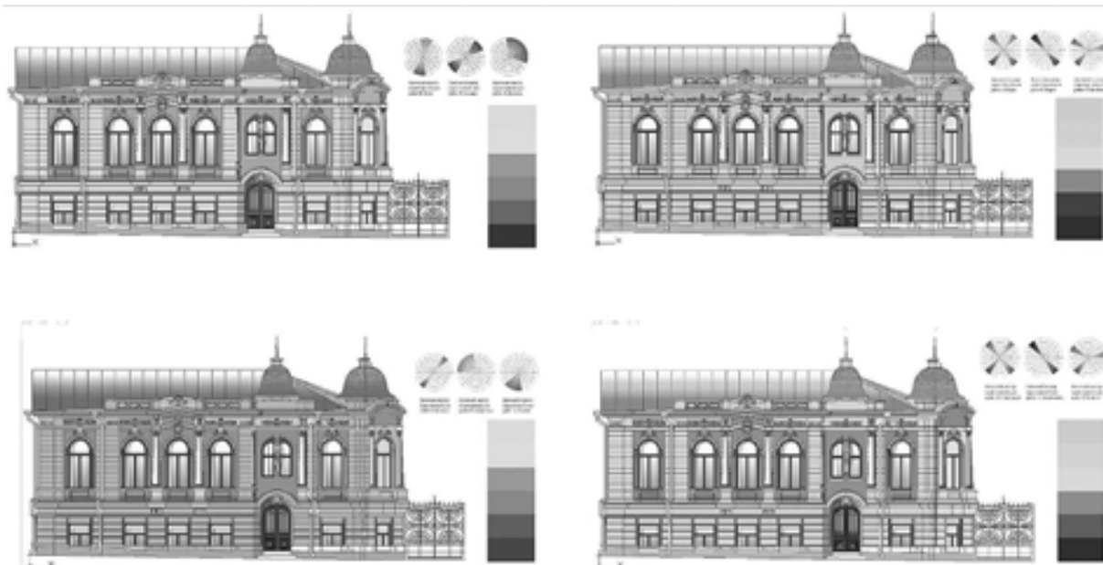
Рис. 4. Варианты расколоровки фасада особняка купца Жоголева в характерных цветовых гаммах выдающихся архитектурных школ модерна рубежа XIX–XX вв.

восприятию произведения для зрителя. При анализе декоративных элементов архитектуры мировых аналогов и, в частности, самарского модерна выделены простейшие геометрические формы, благодаря которым архитектурное убранство особняков легко воспринимаемо, изысканно и, несмотря на обилие декоративных элементов, – не перегружено, как, например, в эклектичном стиле. Основная и самая распространенная форма композиционного построения в элементах декора особняков стиля модерна – это «линия Орта», известная как s-образная линейная концепция. Этот линейный символ является самостоятельным художественным образом, который впервые появился в графических работах ар-нуво. Именно архитектор В. Орта, под влиянием первых художественных выставок ар-нуво, перенёс графику художников модерна в камень, построив дом профессора Эмиля Тасселя [4]. S-образная композиция отчётливо прочитывается в декоративных элементах особняка Курлиной (архитектор А.У.Зеленко).