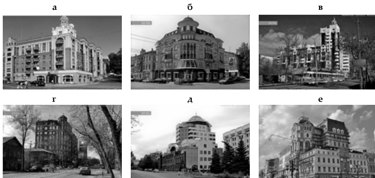
Рис. 5. Современные самарские башни с куполами: а – башня с куполом жилого дома по ул. Максима Горького / Ленинградской, 2; б – купол-«грибок» над башней жилого дома на перекрестке ул. Некрасовской, 55 / Молодогвардейской, 100; в – имитация купольного завершения в виде каркаса модели церкви на углу улиц Арцыбушевской, 76 / Вилоновской, 84; г – реплика исторического «шатра с шариком» по ул. Красноармейской, 75; д – купол-«шляпа» над офисным центром Бэл Плаза на ул. Молодогвардейской, 204; е – вальмовые крыши новостроев «Галерея Атриум» в центральном ядре города на ул. Ленинградской, 66

5, б) появился на месте давнего пустыря на пересечении улиц Некрасовской и Молодогвардейской. Можно спорить о форме, но купол вполне уместен, и по масштабу новый дом вполне вписывается в историческое окружение. На углу улиц Арцыбушевской и Вилоновской, 84 расположено здание, где роль купола играет осуществлённый в виде башенки каркас церковки с луковкой. Неожиданная, несколько спорная интерпретация, но угловой ориентир создан и вполне узнаваемый (рис. 5, в). Образно-смысловой прототип старого доходного дома в стиле модерн по ул. Некрасовской, 57 угадывается в шатровом завершении башни жилого дома с банком на ул. Красноармейской, 75 (рис. 5, г). Преувеличенной по масштабу купольной «шляпой» облегчённой конструкции в духе вентуриевского «здания-утки», полюбившейся жителям ближайшей округи, завершён верх офисно-центра Бэл Плаза (рис. 5, д).