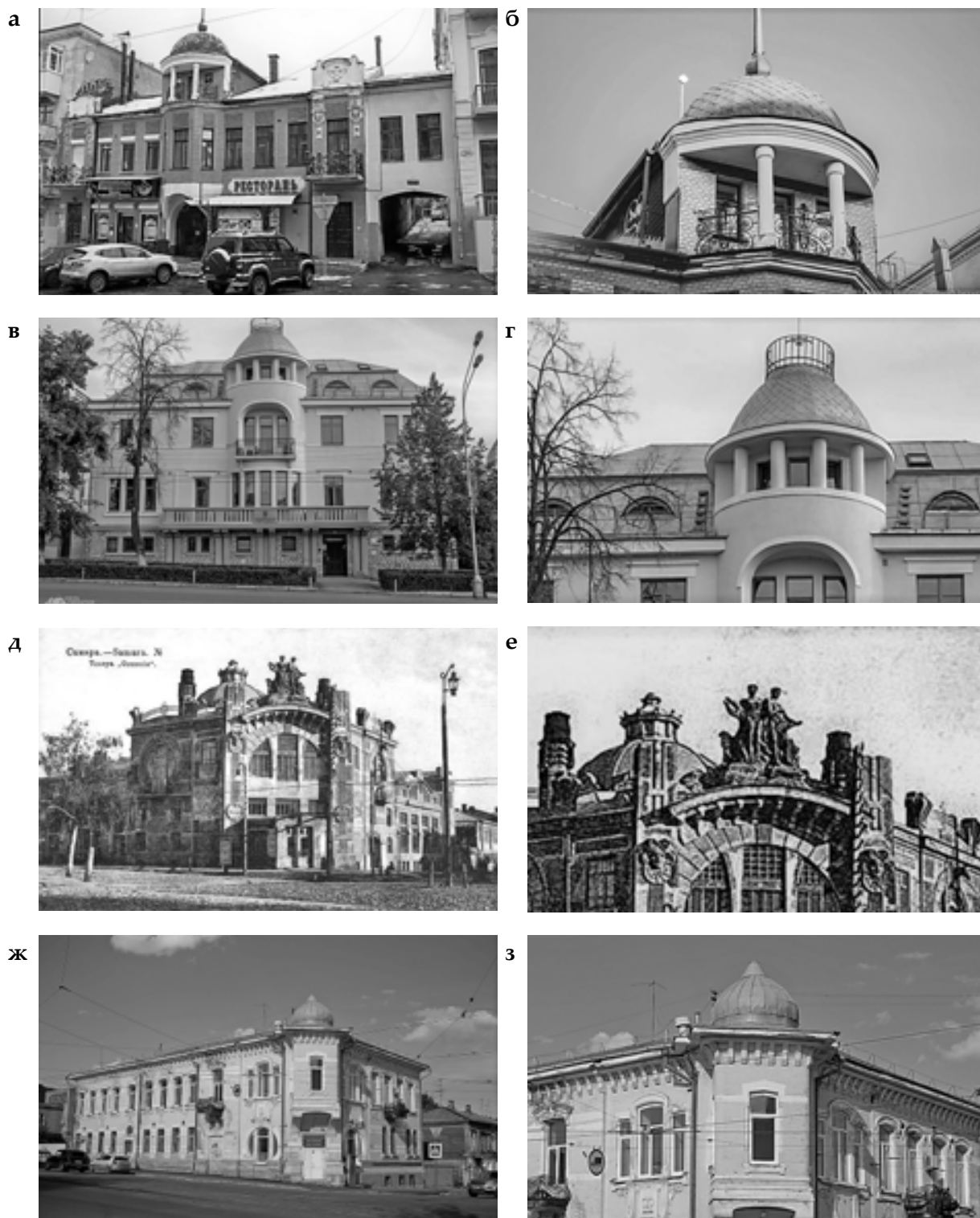
Рис. 1. Шлемовидные сферические купола Самары: а, б – здание П.П. Головкина на ул. Ленинградской, 22 с невысоким сегментом купольной сферы; в, г – особняк А. фон Вакано на ул. Шостаковича, 3 с высокой купольной сферой и балкончиком; д, е – Театр-цирк «Олимп» на ул. Фрунзе, 141 с высоким зонтичным куполом и световым фонарём; ж, з – особняк Благовещенского на ул. Фрунзе, 43 с килевидным куполом, перетянутым декоративным ленточным поясом