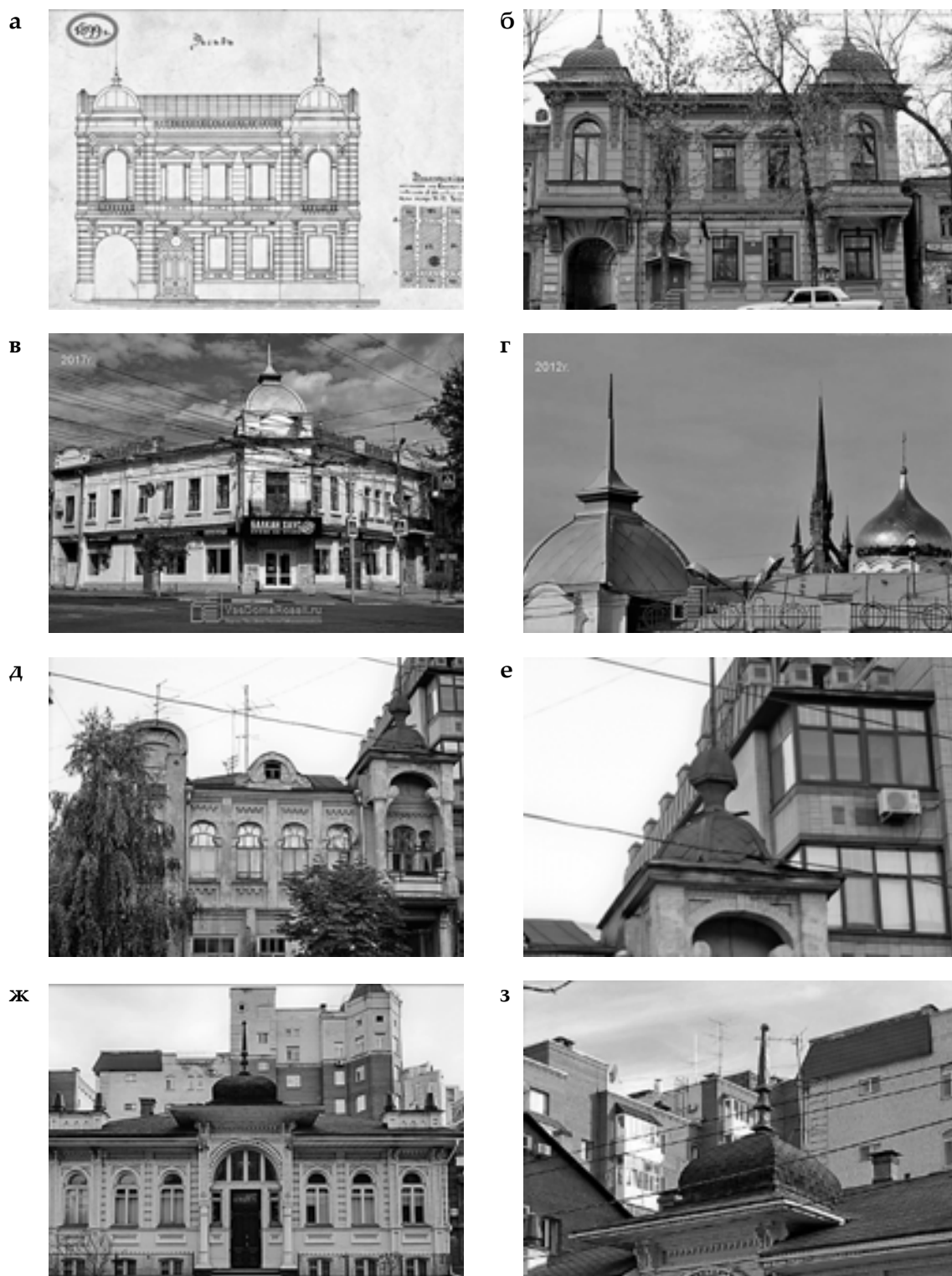
Рис. 2. Полигональные купола Самары: