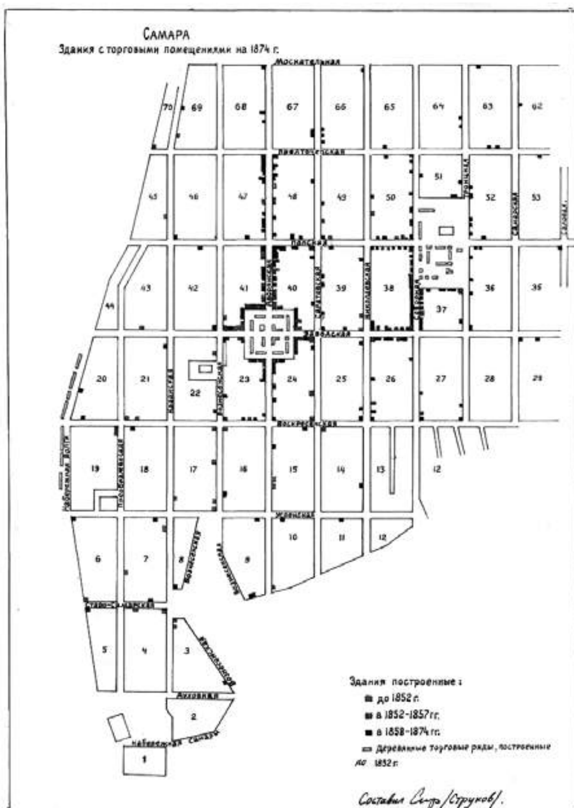
Рис. 1. Карта города Самары 1874 г.