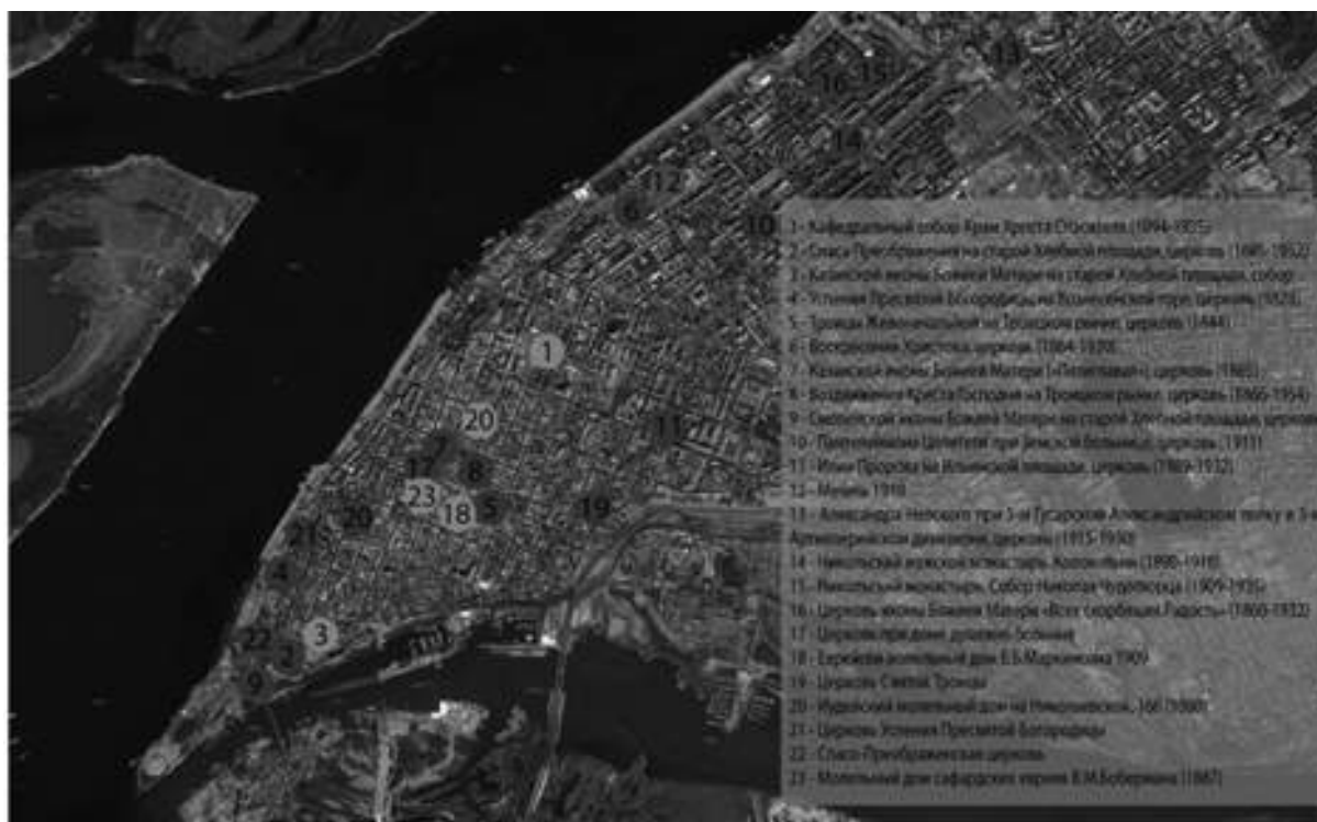
Рис. 3. Утраченные градостроительные доминанты города Самары

Анализ топографической карты г. Самары показал, что Храм в честь иконы Божией матери и Храм Андрея Первозванного расположены на высокому рельефе. Храм всех святых и Храм в честь святых жён Миронисиц расположены в пределах тех же горизонталей, ближе к границе перепада рельефа. Благодаря такому расположению, храмы становятся яркими архитектурными доминантами, выделяясь из окружающей застройки своими преобладающими эстетическими качествами и более крупным масштабом. Иверский монастырь и Храм Георгия Победоносца расположены на крутом волжском склоне и с реки воспринимаются как архитектурные доминанты. Разреженность окружающей застройки выделяет храмы в панораме города. Рассматривая эти и другие примеры действующих культовых сооружений Самары, можно сделать вывод, что расположение здания на рельефе также играет важную роль. Выгодное положение на рельефе города позволяет выделить здание и сделать его хорошо просматриваемым сразу с нескольких городских панорам.