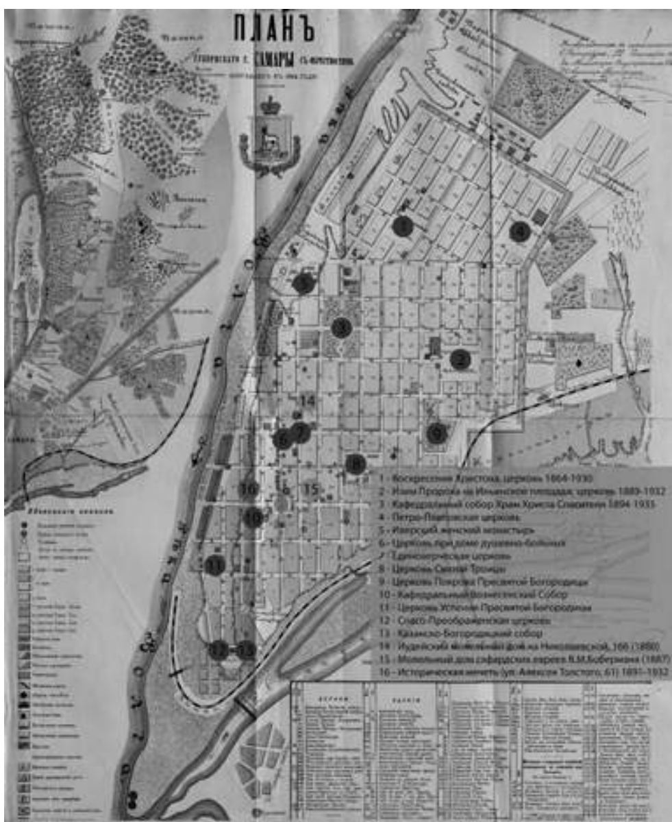
Рис. 2. Культурные архитектурные доминанты на карте города Самары 1894 г.

д) часть сравнительно небольших церквей с невысокими колокольнями, разместившихся в уличной застройке на небольшом пространстве на углу пересекающихся улиц (Успенская церковь на углу бывших улиц Успенской и Преображенской) или в разрыве между жилой застройкой с небольшим отступом от