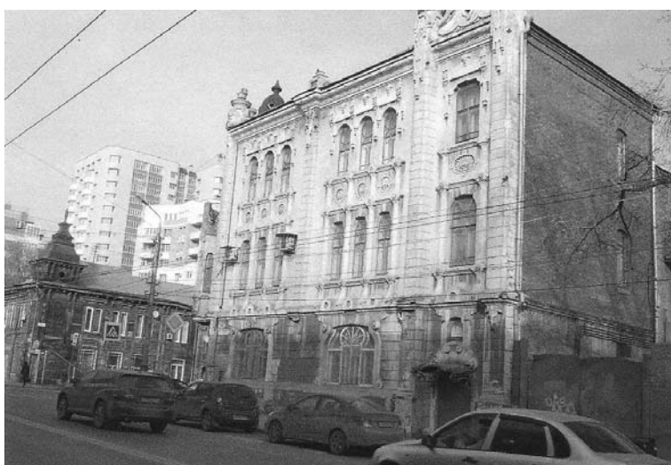
Фото 2. Фасад здания по ул. Самарской