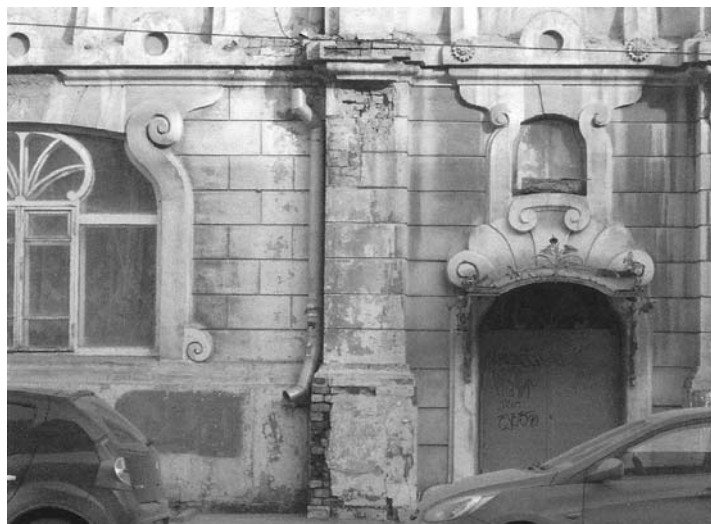
Фото 5. Повреждения облицовки стен и частично кладки атмосферными осадками