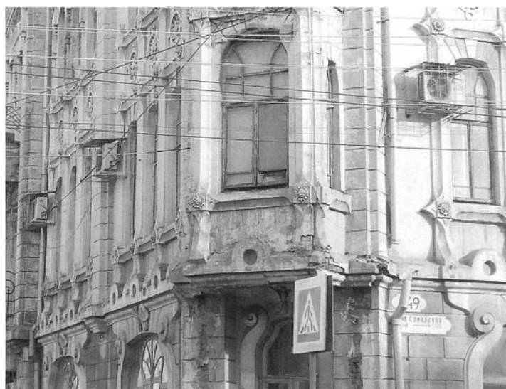
Фото 6. Современные атрибуты на фасаде здания и повреждения в зоне балкона