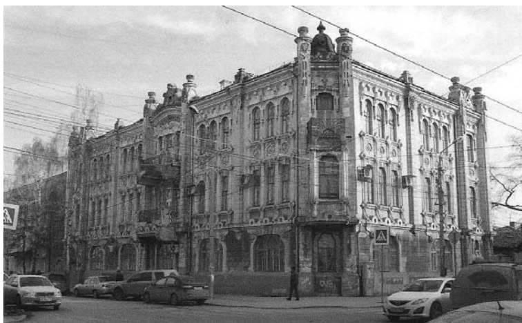
Фото 1. Общий вид здания бывшей женской гимназии