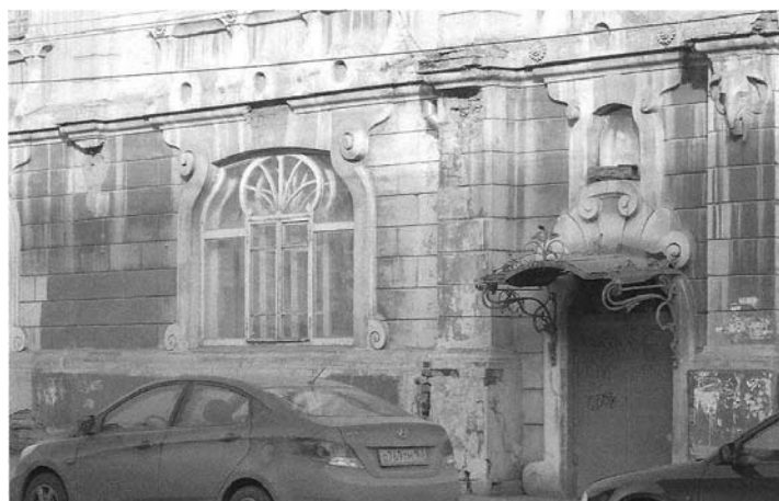
Фото 4. Элементы оформления фасада со следами повреждений