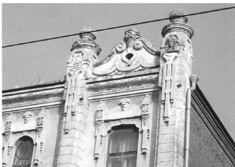
Фото 3. Оставшиеся элементы декора фасада здания