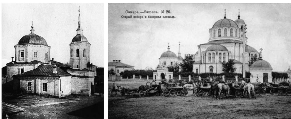
Рис. 4. Спасо-Преображенская и Смоленской иконы Божией Матери церкви

(Духовной, Кутякова). Это объяснялось тем, что в соответствии с первым геометрическим планом все улицы ориентировались на русло Самарской перебоины 4 , а не по оси запад-восток как прежде.