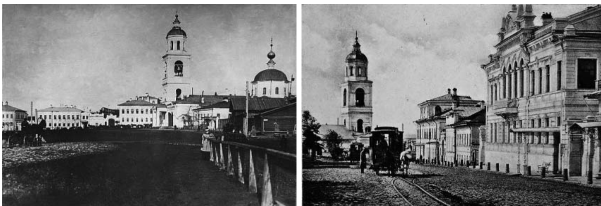
Рис. 3. Казанский собор