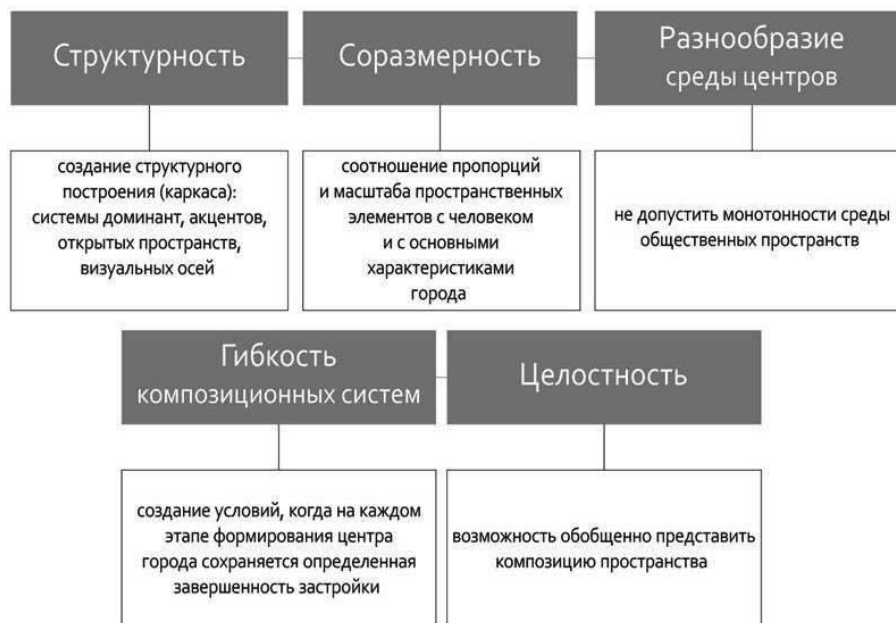
Рис. 1. Основные принципы совершенствования архитектурно-художественного облика городских центров

Данная тема особенно актуальна по отношению к городу Тольятти. Городу относительно молодому, который не несет в своей основе ни градостроительной, ни исторической преемственности. Городу, который задумывался своими создателями как город будущего. Сегодня, к сожалению, монотонность и однообразность среды городских пространств Тольятти является непривлекательной с художественно-эстетической точки зрения. Каждый район современного города проектировался и строился обособленно, решая в конкретный исторический промежуток времени какую-либо первостепенную социально-экономическую задачу, стоящую на тот момент перед градостроителями и проектировщиками Тольятти. Тем самым образовались три достаточно обособленных городских района, с различными планировочными структурами, связь между которыми осуществляется посредством протяженных отрезков городской улично-дорожной сети (УДС). Несвязанность в единую систему трёх основных районов города препятствует созданию единой выразительной городской среды с общим композиционным решением центральных территорий. Сложившаяся на сегодняшний день система центров является раздробленной и не располагает