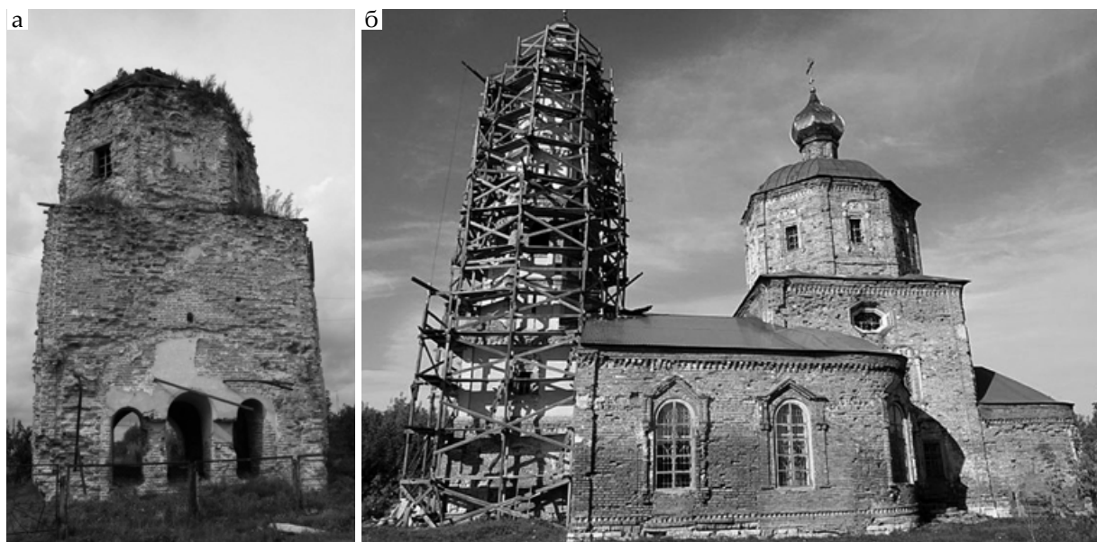
Рис. 2. Церкви в селе Троицкое: а – Рождества Пресвятой Богородицы; б – Троицкая