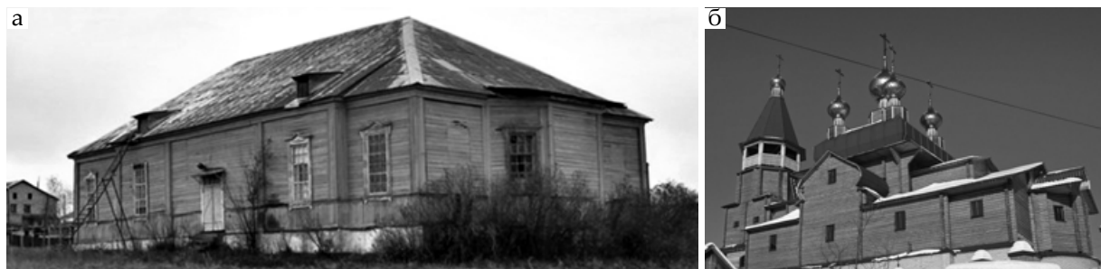
Рис. 4. Деревянные церкви в стилистике классицизма: а – Михаила Архангела в селе Жемковка; б – Сретения Господня в селе Борское