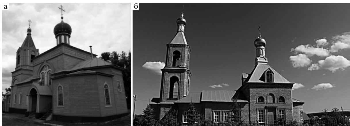
Рис. 5. Церкви в стилистике классицизма: а – Живоначальной Троицы в селе Ташла; б – во имя Казанской иконы Божией Матери в селе Новый Буян