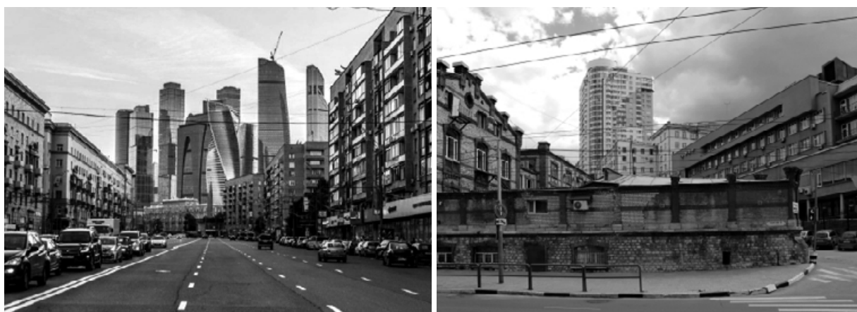
Рис. 2. Наслоение разновременных и разностилевых архитектурных элементов в городской среде