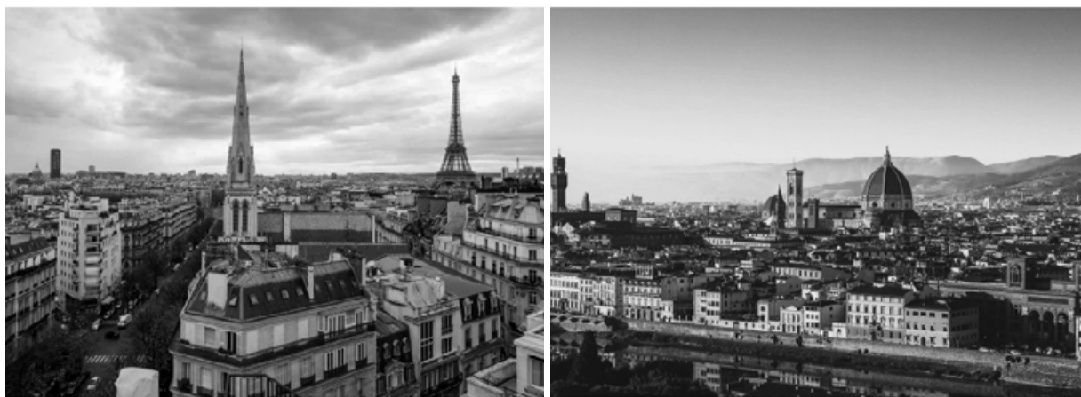
Рис. 6. Панорамы городской среды

из общего окружения, имея геометрически ясную, лаконичную форму и выделяясь из общей массы близлежащей застройки, создавая контрастную ситуацию при взаимодействии фигуры и фона. Город как колоссальное слияние связей без фиксированных мест неизбежно трудно познать; его невозможно визуализировать, расшифровать или изобразить [5].