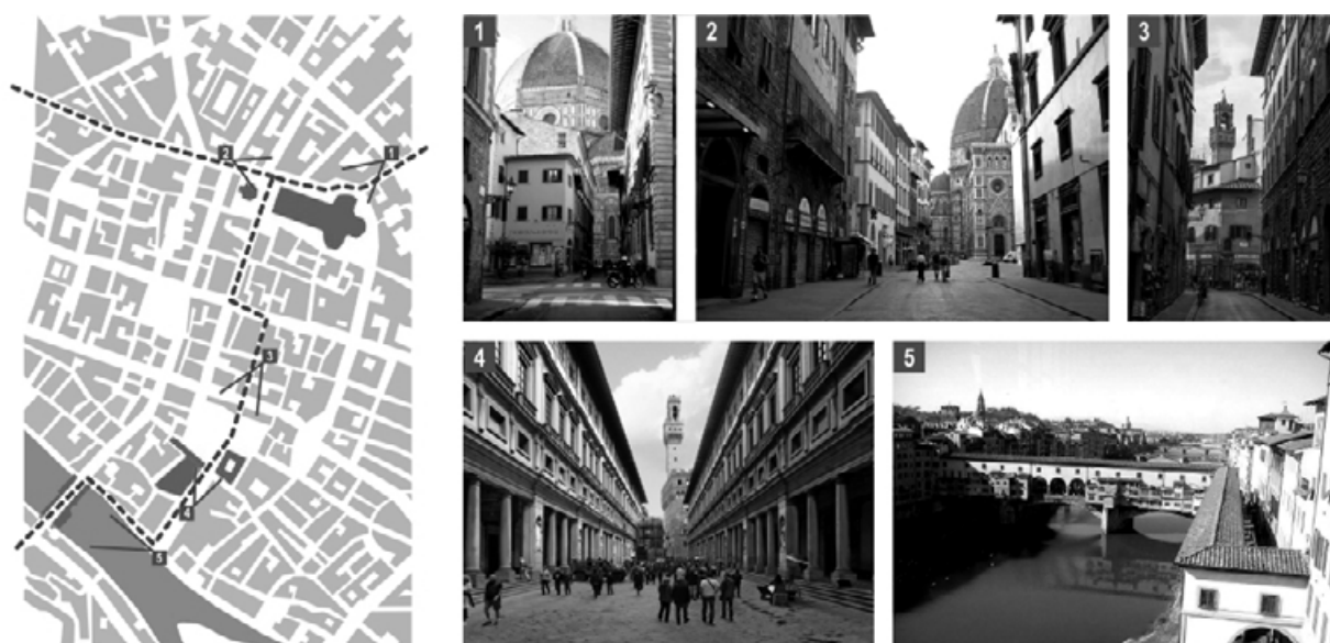
Рис. 3. Система логически выстроенного городского маршрута

Одними из основных средств, наряду с маршрутами и композиционными узлами, участвующими в формировании образа «Города-коллажа», являются разнообразные объемно-пространственные объекты – комплексы