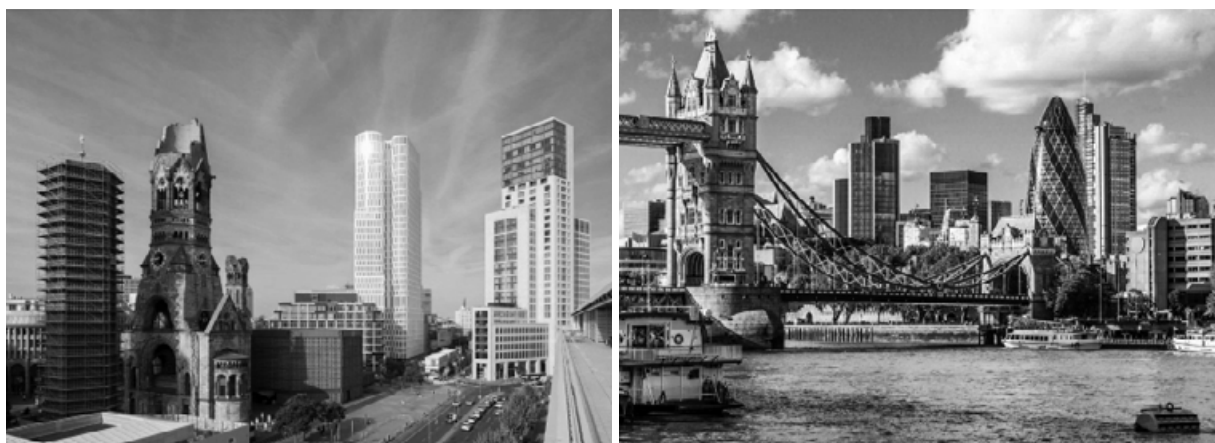
Рис. 1. Эффект «коллажа» в индивидуальном облике города

Каркасом города, его основой служат пространственные связи – маршруты, вдоль которых выстраиваются остальные элементы среды.