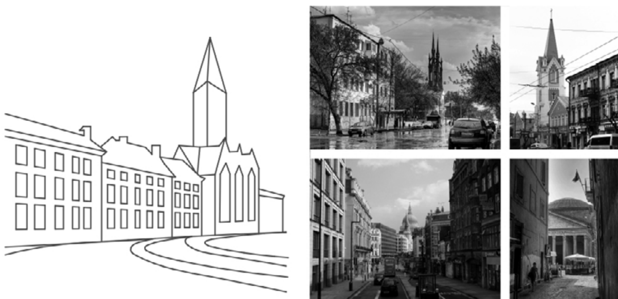
Рис. 5. Градостроительные доминанты в планировочной структуре городской среды