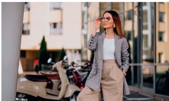
Рис. 4. Примеры дизайна городского пространства и дизайна одежды, сформированные под влиянием урбанистических принципов эффективности, соблюдения человеческого масштаба и сбалансированного движения Fig. 4. Examples of urban space design and clothing design, formed under the influence of urban principles of efficiency, adherence to human scale and balanced movement