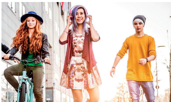
Рис. 3. Примеры дизайна городского пространства и дизайна одежды, сформированные под влиянием урбанистического принципа общения и свободного времяпрепровождения горожан Fig. 3. Examples of urban space design and clothing design, formed under the influence of the urban principle of communication and the free pastime of citizens