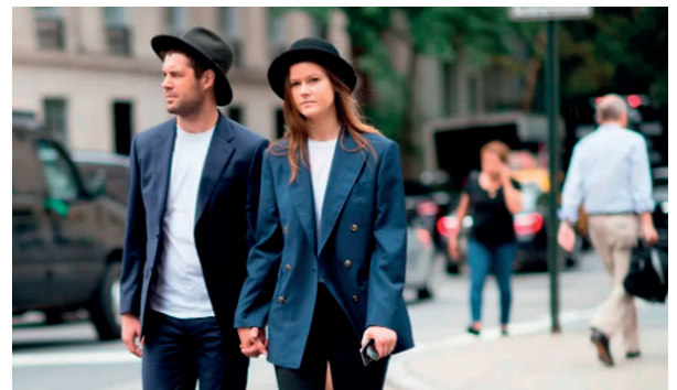
Рис. 5. Примеры дизайна городского пространства и дизайна одежды, сформированные под влиянием урбанистического принципа создания матрицы возможностей Fig. 5. Examples of urban space design and clothing design, formed under the influence of the urban principle of creating a matrix of opportunities

Следуя принципам урбанизма, дизайн городской среды должен быть ориентирован на людей, их комфорт и безопасность, а также на сохранение культурного наследия и при-