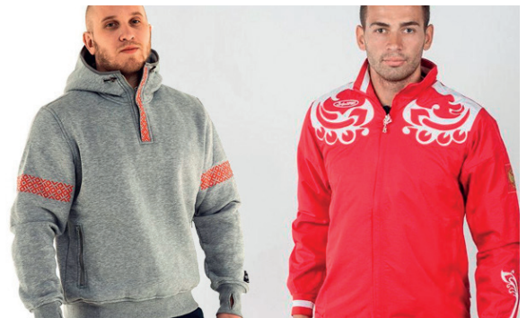
Рис. 2. Примеры дизайна городского пространства и дизайна одежды, сформированные под влиянием урбанистического принципа поддержки культуры и традиций