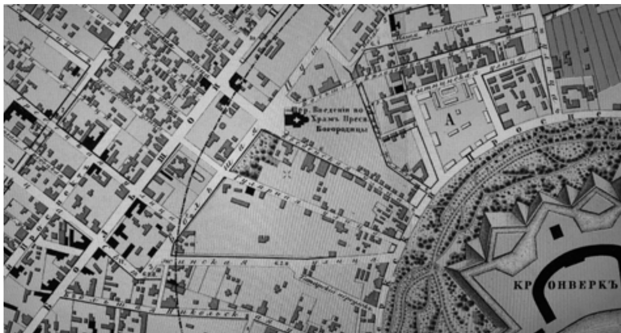
Рис. 1. Регулярная сетка полковых слобод и веерная система улиц, окружающих Кронверк (фрагмент Плана Петербургской части города 1861 г.)

Постройка в 1903 г. Троицкого моста значительно отодвинет границу города на север, а Петербургский остров переживет настоящий строительный бум. На месте деревянных домиков, оставшихся от полковых слобод и обывательской усадебной застройки, буквально за одно десятилетие возникнут многоэтажные репрезентативные каменные жилые дома. Главной репрезентативной магистралью становится Каменноостровский проспект, представляю-