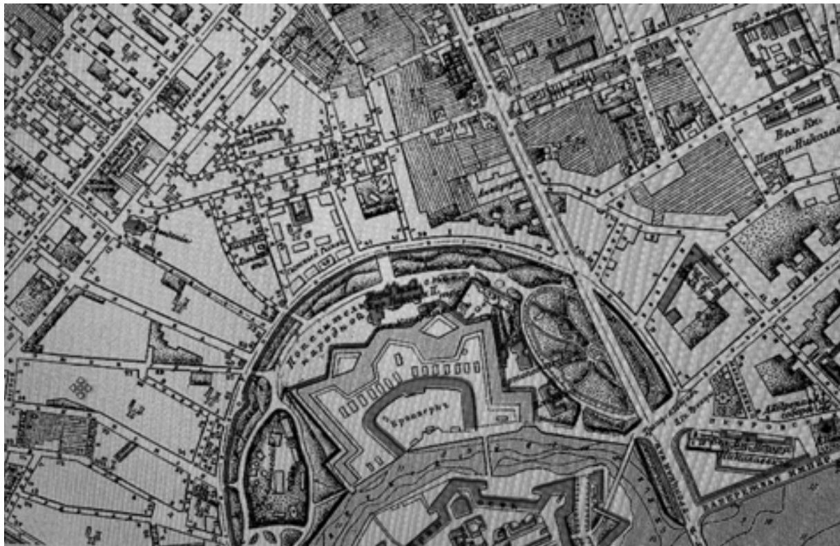
Рис. 2. Формирование кварталов Каменноостровского проспекта (фрагмент карты «Санкт-Петербург с показанием улиц, набережных, площадей и проч. с присвоенными наименованиями начиная с 7 марта 1880 года по 1 сентября 1904 года, а также всех городских имуществ и отmelей в устье реки Невы, 1904 г. Регулярная сетка полковых слобод и веерная система улиц, окружающих Кронверк, фрагмент Плана Петербургской части города 1861 г.»)

В XVIII столетии основными доминантами в западной части острова являлись купола