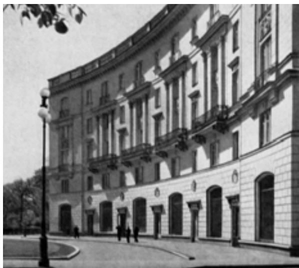
Рис. 3. Здание, формирующее площадь у метро «Горьковская» (О. Гурьев, В. Фромзель, 1949–1951 гг.)

и звонницы церквей, участвующих в визуальных связях с градообразующими ансамблями [9]: