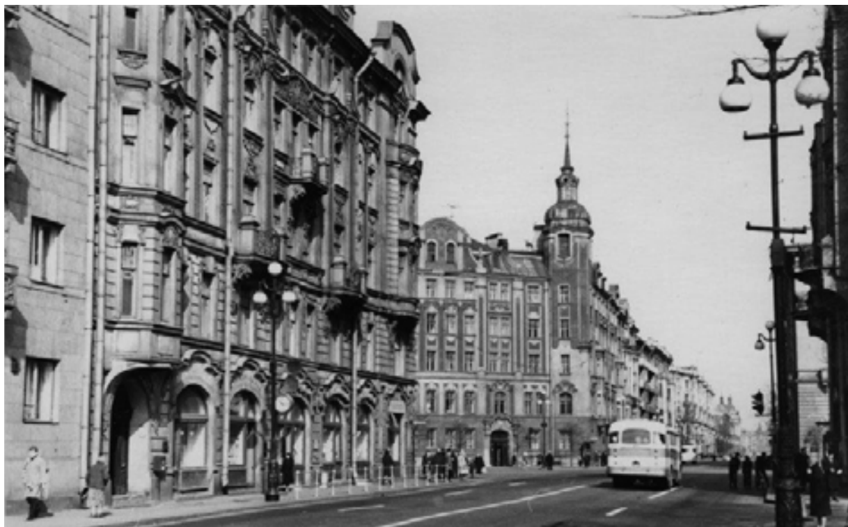
Рис. 4. Перспектива Каменноостровского проспекта в сторону Австрийской площади

Жемчужиной Каменноостровского проспекта несомненно является Австрийская площадь (рис. 4), намеченная еще на генеральном плане Петербурга 1831 г. Свою восьмиуголь-