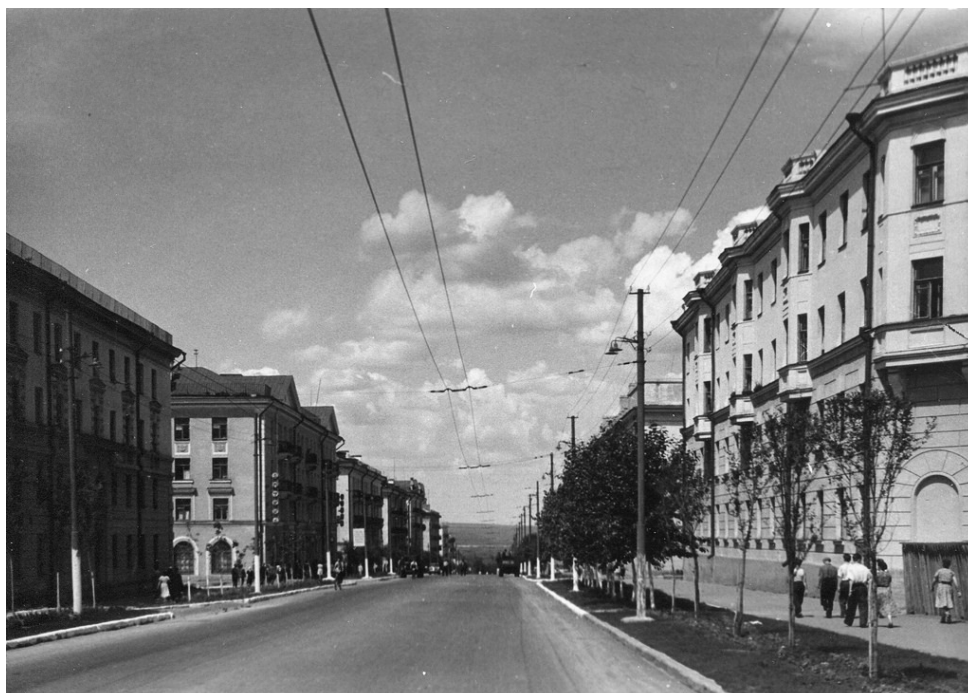
Рис. 3. Застройка проезда Масленникова, фото 1950-х гг.

22 октября 1954 года № 468-р был утвержден акт приемочной комиссии о сдаче в эксплуатацию жилого дома на 27 квартир с библиотекой и детскими яслями по пр. Масленникова. Четырехэтажное кирпичное здание состоит из трех секций. Построено на ленточном фундаменте из бутового камня, имеет железную кровлю и деревянные перекрытия. Запроектированы все виды инженерно-коммуникационных сетей: центральное отопление, водопровод, электроосвещение, канализация, газификация [3, 4].