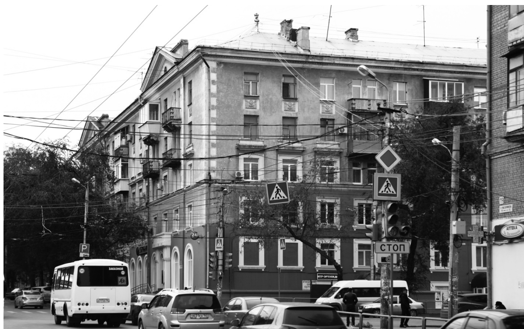
Рис. 5. Жилой дом, ул. Масленникова, 21, 1950-е

никовой в квартале № 362 проектировался как часть крупного градостроительного ансамбля в границах пр. Масленникова и улиц Гая и Подшипниковой. Типовой проект был утвержден 29 октября 1951 года. Строительство здания начато в июне 1952 года и завершилось в декабре 1954 года. Ввод в эксплуатацию – акт приемочной комиссии о сдаче в эксплуатацию жилого дома на 12 квартир по ул. Подшипниковой от 4 марта 1954 года № 165. Четырехэтажное кирпичное здание состоит из одной секции. Имеет все виды инженерно-коммунальных сетей. Архитектура здания решена в стиле советской классики. Главный фасад здания имеет симметричную композицию. Центральная ось здания подчеркнута расположенным в уровне первого этажа парадным входом и декоративным порталом. Плоскость фасада завершена треугольным фронтоном с лепным декором. Окна третьего этажа декорированы прямыми профилированными сандриками. В угловой части первого этажа размещаются ниши с арочными очертаниями. На четвертом этаже углы здания акцентированы лоджиями. На боковых фасадах в простенках расположены круглые медальоны, в центре, на третьем этаже, запроектирован балкон [4, 8].