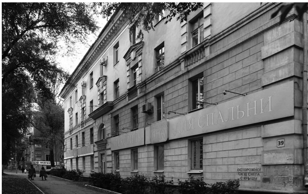
Рис. 6. Жилой дом, ул. Масленникова, 39, 1950-е

ского Совета депутатов трудящихся 14 февраля 1951 года. В качестве замечаний экспертом, архитектором И.Г. Салоникиди, были отмечены: неоправданная «сбоченность» парадного входа, необходимость основательной проработки композиции фасада. Дома, обозначенные на плане литерами «А», «Б», «В», должны были выглядеть по пр. Масленникова как единый ансамбль. Просветы между торцами зданий планировалось заполнить каменной оградой. Строительство велось отделом капитального строительства 4 ГПЗ (подрядчик – жилищно-строительный цех завода). Сооружение здания было начато в мае 1954 года и завершено в январе 1956 года. Здание 4-этажное, кирпичное, состоит из трех секций. Имеет все виды инженерно-коммуникационных сетей: центральное отопление, водопровод, электроосвещение, канализацию, газоснабжение [9–11].