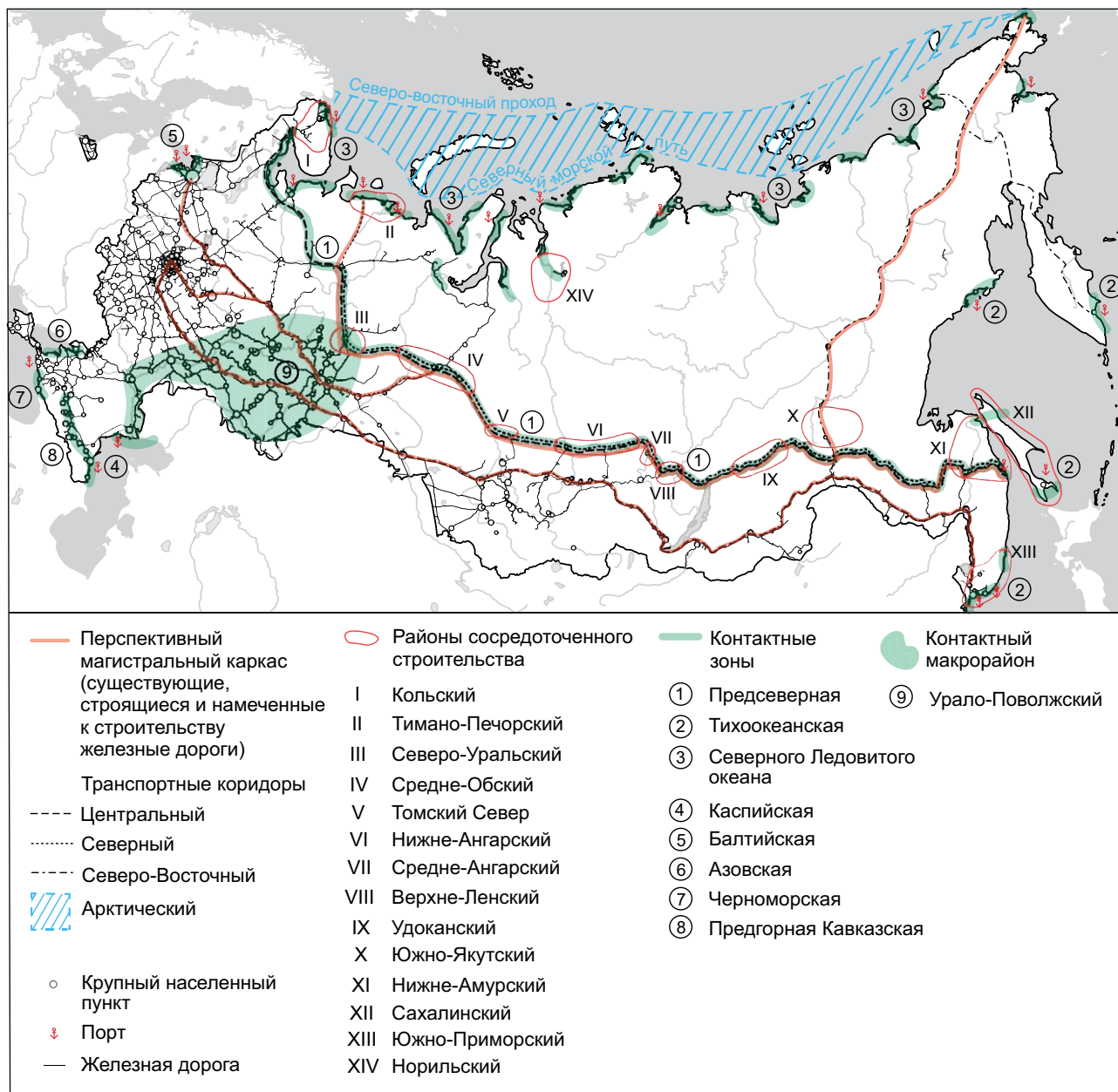
Рис. 1. Перспективная территориальная организация России. Основные элементы.

Рисунок выполнен А.В. Шелудковым по эскизу Г.М. Лаппо.