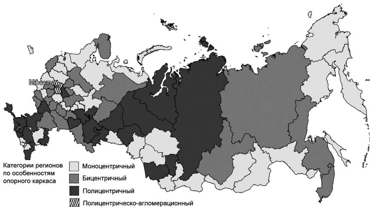
Рис. 2. Моноцентричные, бицентричные и полицентричные регионы России.

Рисунок выполнен А.В. Шелудковым по эскизу Г.М. Лаппо.