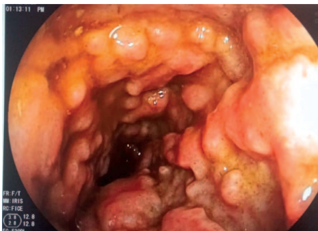
Рис. 1. Множественные бляшковидные очаги желтоватого цвета на слизистой оболочке в прямой кишке.