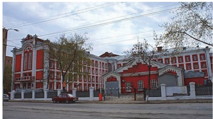
Здание бывшей самарской тюрьмы. Улица Арцыбушевская, 171.