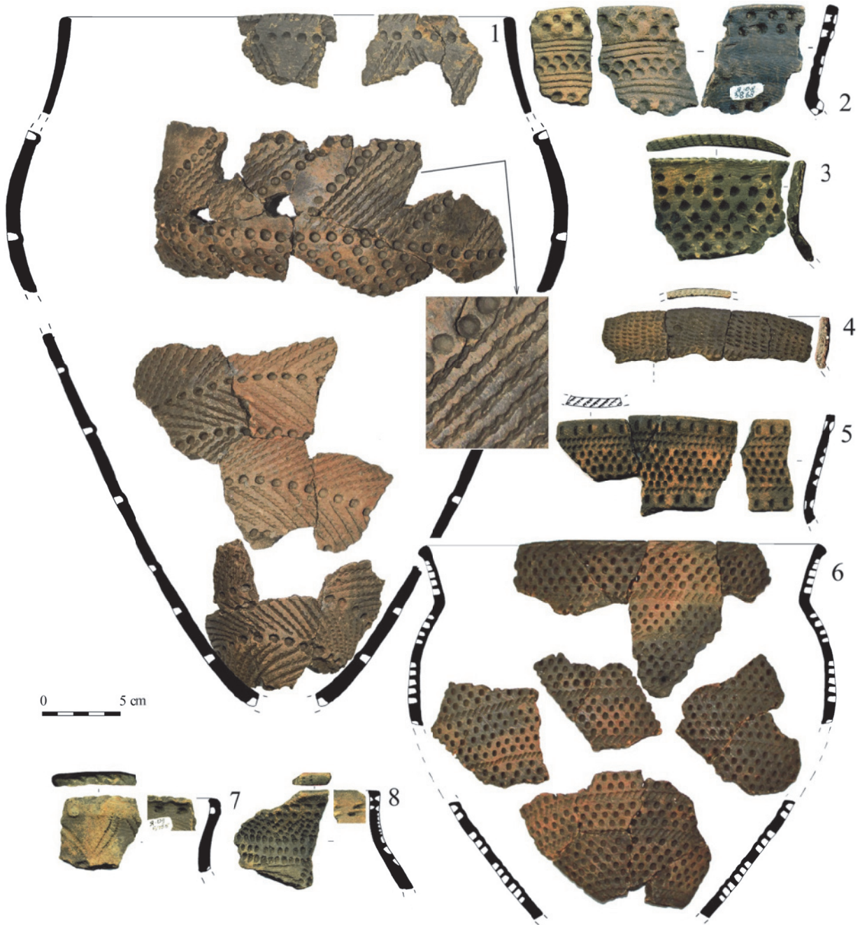
Рис. 2. Стоянка Ямное. Керамика позднего неолита

дате, сделанной по среднестоговской керамике. Средний слой: 5690 \pm 100 BP, 4760-4345 CalBC, 2\sigma (SPb_2597); верхний слой: 5217 \pm 70 BP, 4240-3811 CalBC, 2\sigma (SPb_2596).