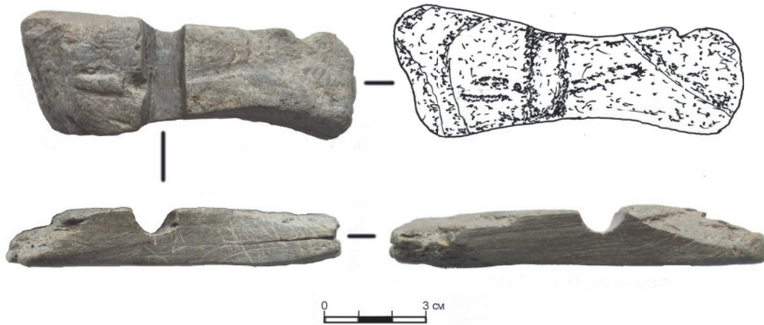
Рис. 3. Поперечно-желобчатое изделие из талька

«утюжков» козловско-полуденской культуры» 7 . Это, по мнению автора, тяготение таких артефактов к узким и высоким пропорциям, жесткий рельеф с выделенными боковыми гранями и узкой верхней частью, на которой размещался орнамент. Причем типичным является асимметричность декора относительно желобка, а преобладающими элементами орнамента являются прямая линия и косая сетка 8 . Практически все эти характеристики соответствуют представленному «утюжку». Исключением является наличие орнамента в виде зигзагов на боковых гранях изделия, что, по мнению И.В. Усачевой, больше характерно для боборыкинской культуры 9 , однако, как отмечает сам автор, изредка встречается и на «утюжках» козловско-полуденской культуры, например, на памятниках Шайдуринское V или Исетское Правобережное I 10 .