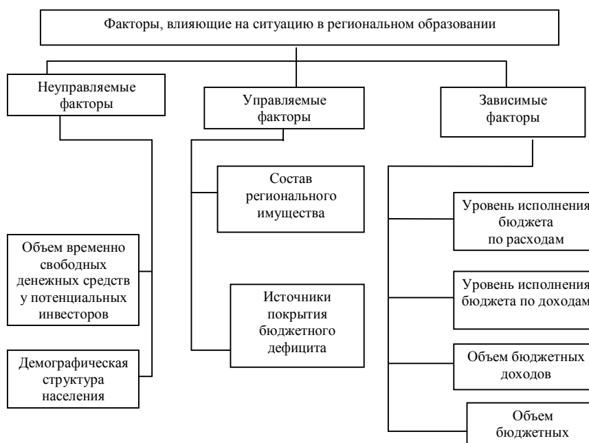
Рис. 2. Классификация факторов, влияющих на ситуацию в региональном образовании (в зависимости от возможности воздействия на них региональных и муниципальных образований)