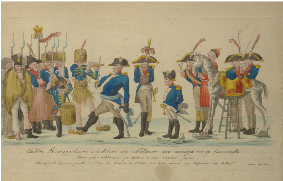
Рис. 14. Грав. И.И. Тербенев. Смотр французским войскам на обратном их походе чрез Смоленск: Хотя одеты некрасиво да тепло, а это главное дело! 1813 г. Офорт. Лист – 30,6 x 44 см.