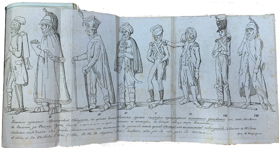
Рис. 5. Грав. М. Богучаров. Военное одеяние французской гвардии во время как большая армия свободно производила попятное движение свое от Москвы к Вильне за Вислу, Одер, Эльбу, и проч., и проч. и проч. («Сын Отечества», 1813 г., Ч. 5, № 19). Офорт. Лист – 43,8 x 18,3 см.