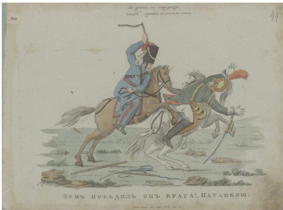
Рис. 3. Чем победил он врага? Нагайкою! Офорт. Лист – 28,5 x 38,9 см. Российская национальная библиотека