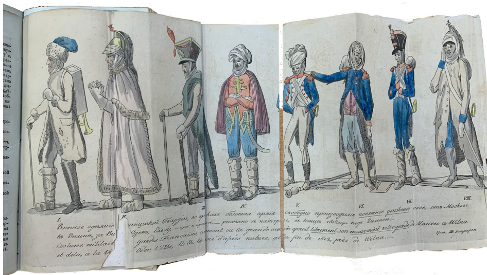
Рис. 6. Грав. М. Богучаров. Военное одеяние французской гвардии во время как большая армия свободно производила попятное движение свое от Москвы к Вильне за Вислу, Одер, Эльбу, и проч., и проч. и проч. («Сын Отечества», 1813 г., Ч. 5, № 19). Офорт, акварель. Лист – 43,8 x 18,3 см.