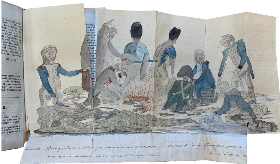
Рис. 7. Грав. М. Богучаров. Бивак французских войск под Вильною, на попятном их пути («Сын Отечества», 1813 г., Ч. 7, № 27). Резец, акварель. Лист – 37,9 x 21,7 см.