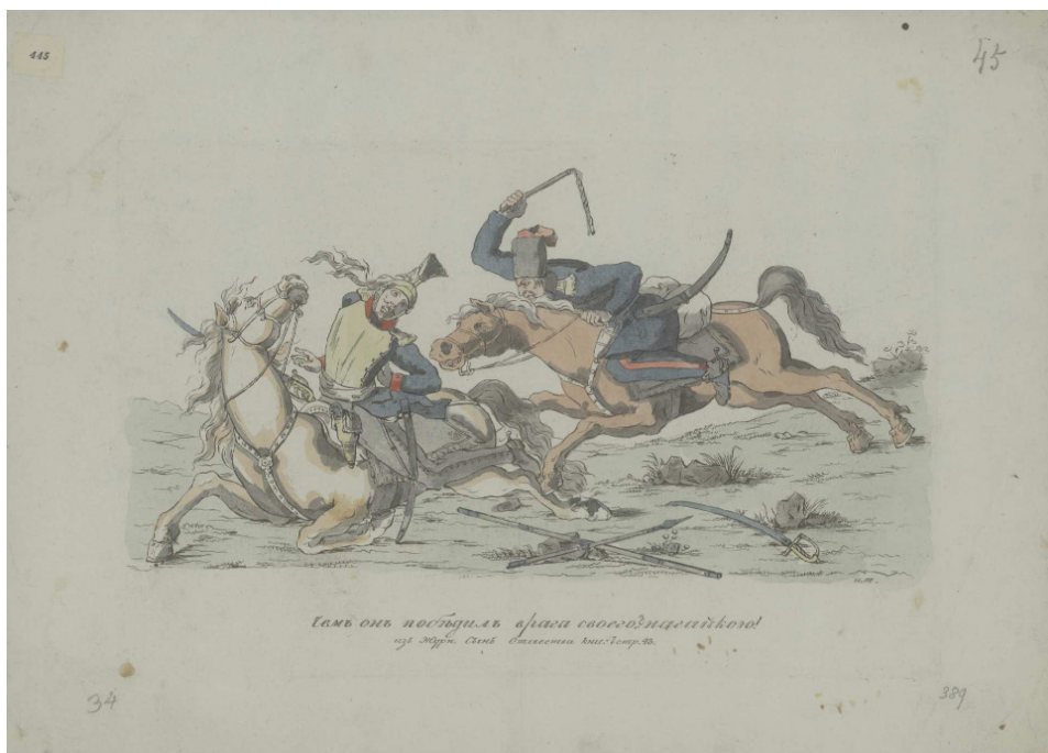
Рис. 1. Рис. и грав. И.И. Тербенев. Чем он победил врага своего? Нагайкою! Офорт, акварель. Изобр. – 20 x 32,5; лист – 30 x 40 см. Российская национальная библиотека