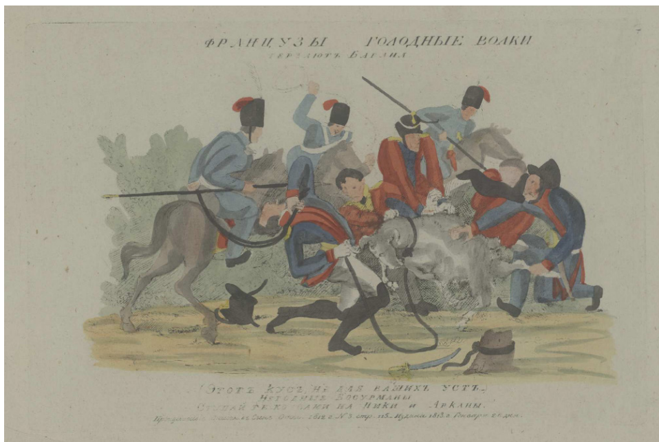
Рис. 4. Французы голодные волки терзают барана. Офорт. Лист – 19 x 29,2 см. Российская национальная библиотека