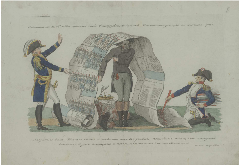
Рис. 11. Грав. И.И. Тербенев. Собранная на Эльбе обсервационная армия французская. Офорт. Изобр. – 22,5 x 33,3; лист – 29,2 x 40,7 см.