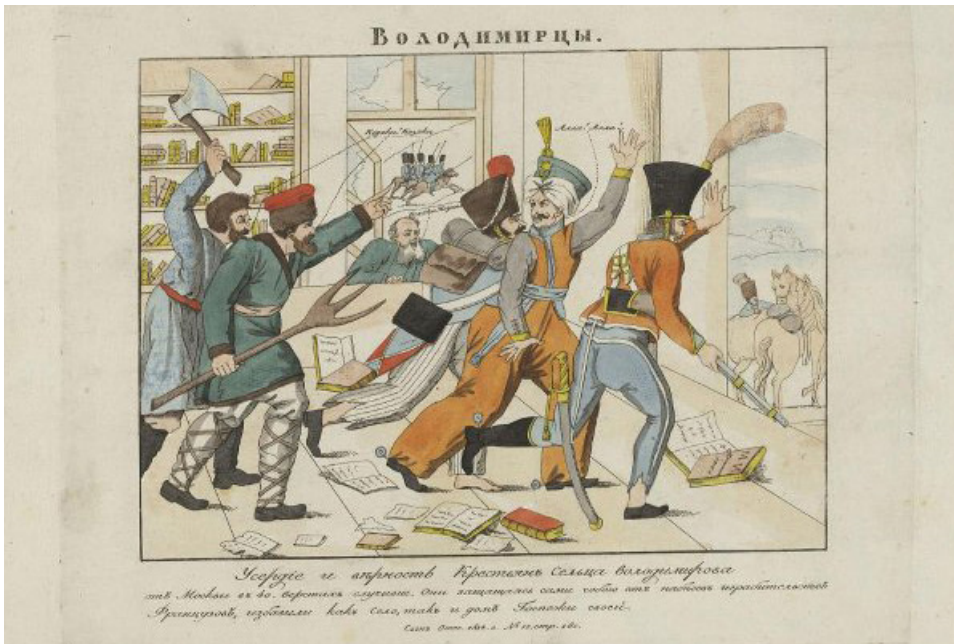
Рис. 12. Грав. И.С. Бугаевский-Благодарный. Володимирцы. Офорт. Лист – 34,5 x 43 см. Государственный исторический музей