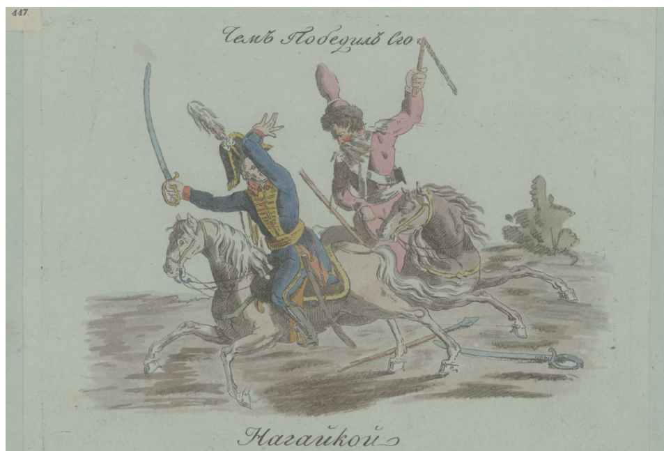
Рис. 2. Чем победил его? Нагайкой. Мягкий лак. Изобр. – 20,5 x 26,8; лист – 21,5 x 28,5 см. Российская национальная библиотека