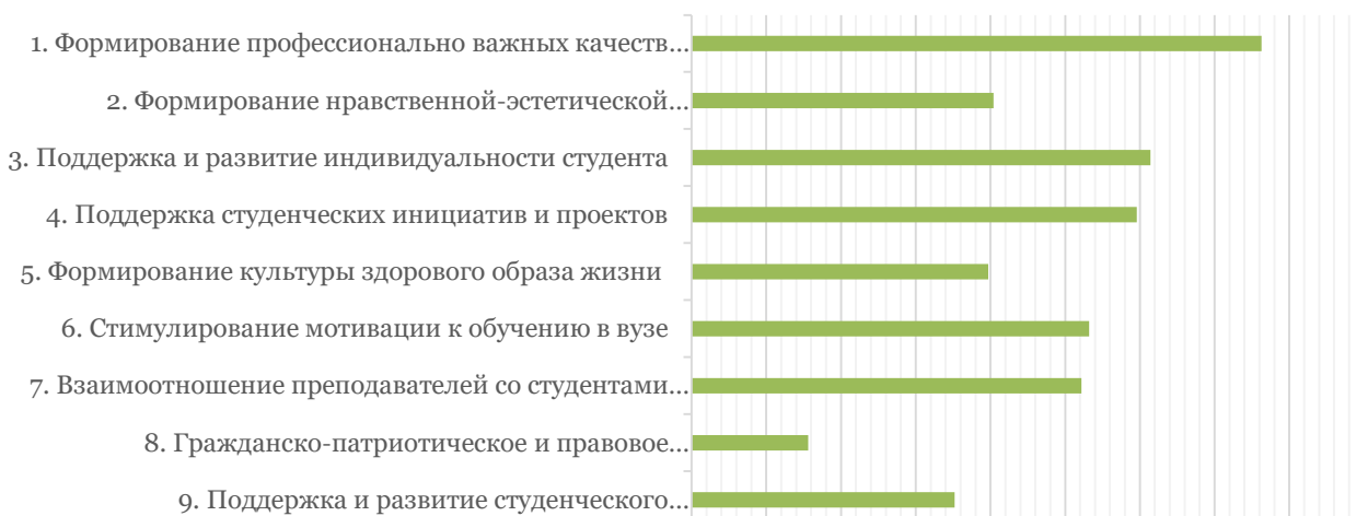
Рисунок 3. Задачи воспитательной работы университета

Проведенное исследование позволило авторам сделать ряд выводов.