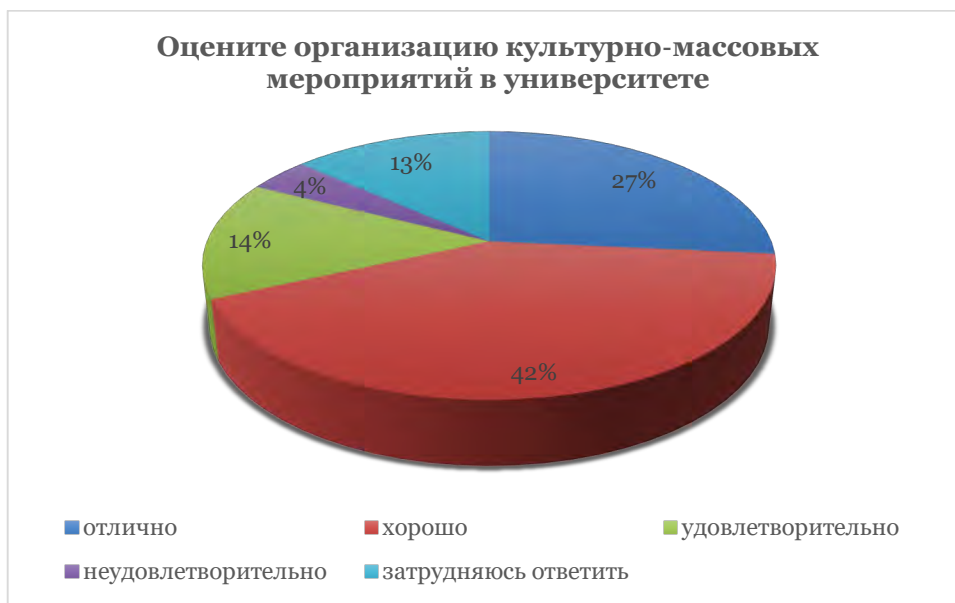
Рисунок 2. Отношение студентов к культурно-массовым мероприятиям в университете.

Большинство опрошенных респондентов (64,0%) отмечают комфортную атмосферу при участии во внеучебных мероприятиях, и что более важно, формирование доброжелательных и дружественных отношений среди участников, что создается на основе взаимопонимания и сотрудничества даже в условиях конкуренции.