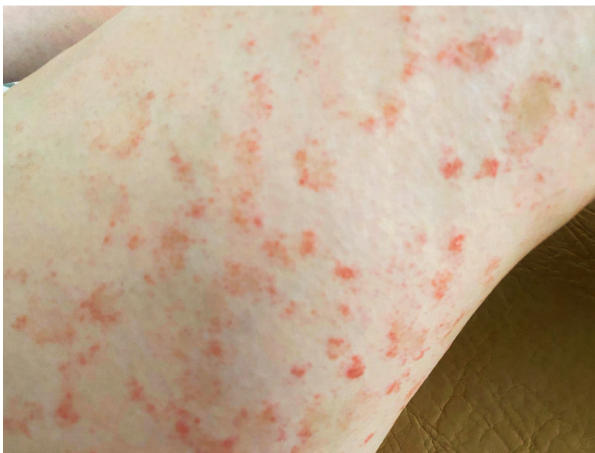
Рис. 2 Проявления капиллярита и остаточные явления розового лишая на поверхности бедра пациентки В

болезненный в зоне Шоффара. В левой подвздошной области пальпируется дополнительная петля сигмовидной кишки. Симптомы раздражения брюшины отрицательные. Симптомы желчного пузыря (Кера, Мерфи, Ортнера) отрицательные. Печень по краю реберной дуги, край ее ровный, гладкий, эластичной консистенции, чувствительный при пальпации. Симптомы Де-Жардена, Мейо-Робсона отрицательные. Симптом поколачивания отрицательный с обеих сторон.