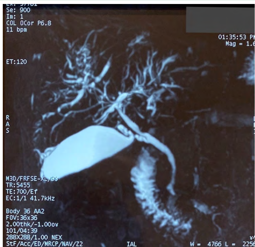
Рис. 3. Результаты МРХПГ пациентки В

После проведенного дополнительного обследования пациентке выставлен заключительный клинический диагноз: