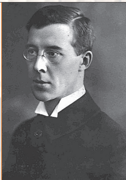
П.А. Сорокин, создатель современной социологии, преподаватель ПХФИ в 1919–1920 годах