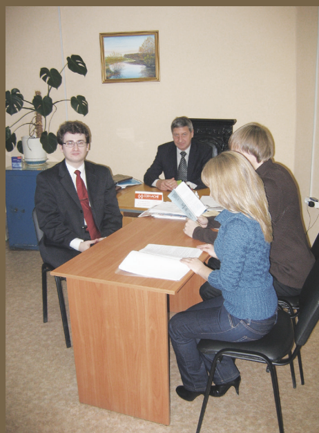
Рис. 3. Работа с коллективом и студентами Fig. 3. Working with the team and students