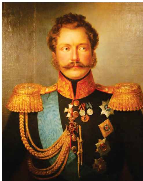
Рис. 4. Портрет Великого князя Михаила Павловича. Худ. Ф. Крюгер, начало 1830-х гг.