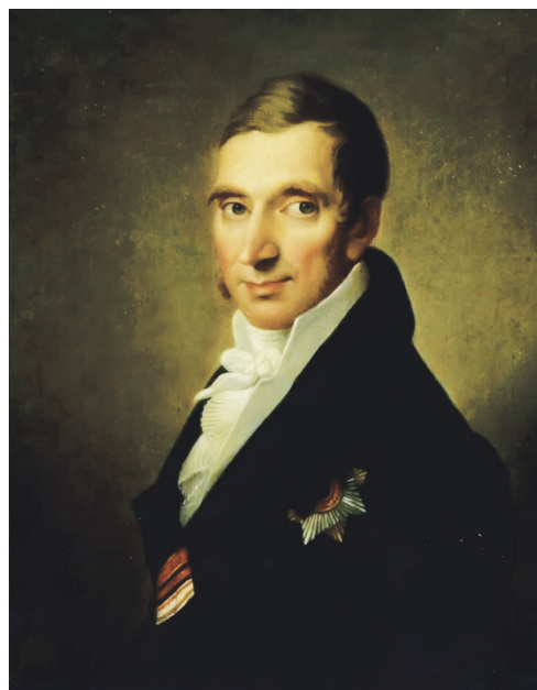
Рис. 5. Портрет Ивана Федоровича Рюля. Худ. И.В. Лучанинов, 1824 г.

и Польской кампании 1831 г. [12]. Во время визита в 1843 г. великого князя Михаила Павловича в Англию его лейб-медик был возведен 4 ноября лично королевой Викторией в достоинство сэра [8].