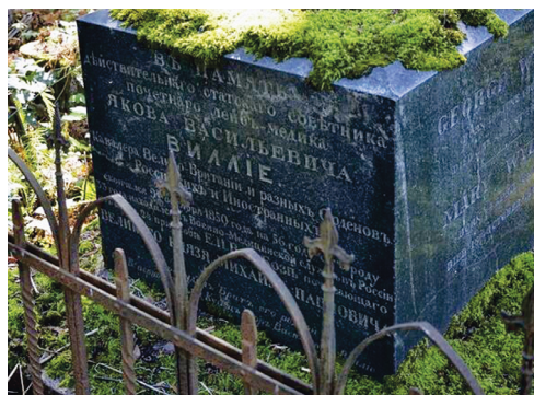
Рис. 6. Надгробие на могиле Я.В. Виллие 2-го

Впечатляет список его наград, и не только российских: орден Святого Владимира 4-й степени, Святого Владимира 3-й степени (1831 г.) и Святой Анны 2-й степени, прусский орден Красного Орла (Roter Adlerorden) 2-й степени, баденский орден Церингенского Льва (vom Zähringer Löwen), савойский орден Святых Маврикия