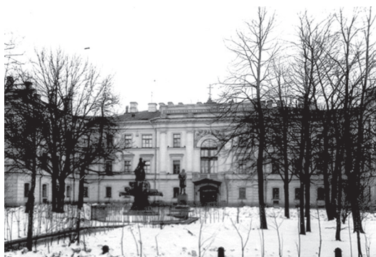
Рис. 7. Здание Михайловской больницы баронета Виллие, начало XX века

и Лазаря (Ordine dei Santi Maurizio e Lazzaro), а также медали — «За русско-турецкую войну 1828–1829 гг.» и «За взятие Варшавы» [8].