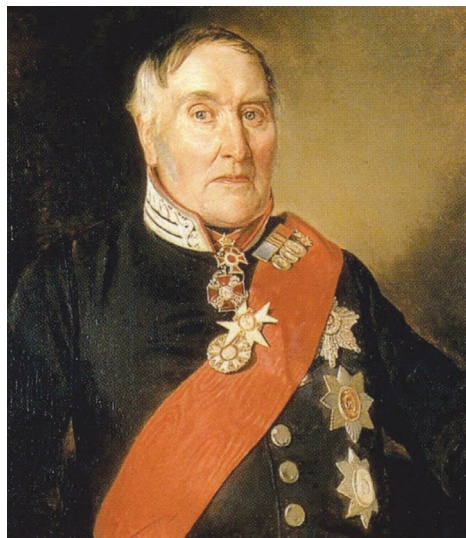
Рис. 2. Яков Васильевич Виллие – старший. Портрет работы М.А. Зичи, конец 1840 – начало 1850 гг.