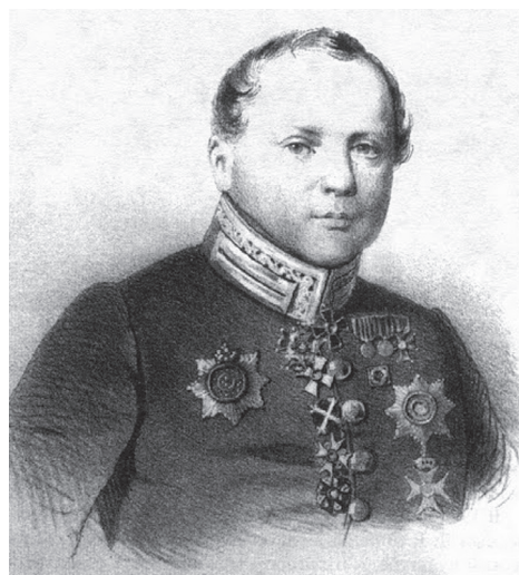
Рис. 3. Яков Васильевич Виллие (James (или Jacobus) Wylie) – младший. Портрет работы В.Ф. Тимма

здесь есть несколько степеней) и который никто не может получить, пока не проведет три крупные операции на живом пациенте. Я сдал все экзамены на это звание и надеюсь, что со временем смогу получить его. Оно было введено дядей, когда он стал руководить Медицинской