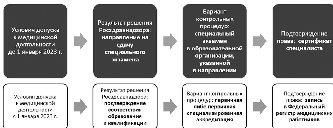
Рисунок. Блок-схемы процедур принятия решения в отношении лиц, получивших медицинское (фармацевтическое) образование в иностранном государстве, на допуск к профессиональной деятельности до и после 1 января 2023 г.

к нарушениям трудовых прав граждан, получивших образование в иностранном государстве и успешно сдавших специальный экзамен. Это выразилось в отстранении данных лиц от трудовой деятельности по причине отсутствия аккредитации специалиста. Документом, устранившим это противоречие, явился новый Федеральный закон от 17 февраля 2023 г. № 16-ФЗ 12 , регламентирующий особенности отношений в сфере здравоохранения на вошедших в состав РФ новых субъектах. В частности, до 1 января 2026 г. определен период, в течение которого должна быть пройдена аккредитация специалистами, получившими до 1 марта 2023 г. образование на территориях Донецкой и Луганской народных республик, Запорожской и Херсонской областей, а также Украины.