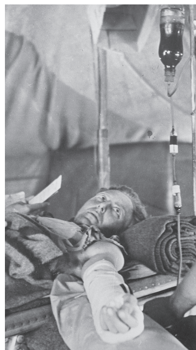
Рис. 8. Переливание крови в полевых условиях

Особенно плодотворная работа в области создания кровезаменителей была проведена на кафедре патофизиологии ВМедА. Разработанная ее коллективом жидкость состояла из гипертонического солевого раствора, к которому добавлялось 10 % донорской крови. Эта жидкость успешно применялась во время Отечественной войны, особенно на медицинских пунктах передового расположения. Среди многочисленных составов, предложенных хирургами, физиологами, патофизиологами, «самым лучшим коллоидным кровезамещающим раствором оказалась жидкость Петрова». Общее количество введений этой жидкости по отношению к переливанию крови составило в 1945 г. 47,3 % (рис. 8).