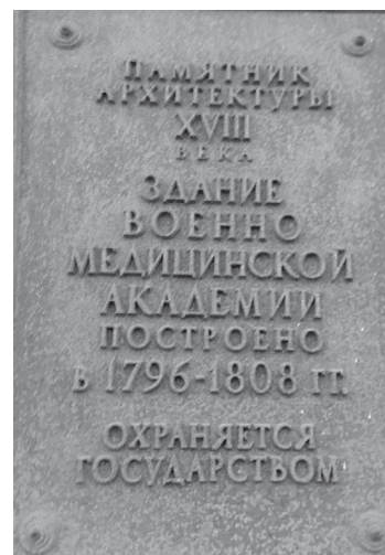
Рис. 1. Мемориальная доска на здании управления Военно-медицинской академии по улице Академика Лебедева

Учитывая повышенное внимание к медицине Павла I, неоднократно посещавшего Сухопутный и Адмиралтейский госпитали, было целесообразно при проведении реформ в этой области заручиться поддержкой императора, приписав ему честь основания академии. Недаром сразу прозвучали предложения о названии «Павловская Медико-хирургическая академия». В данном случае речь о простом переименовании училища в академию уже идти не могла: ведь сам император становился основателем [4]. Этот политический ход имел успех. Академия, заручившись высочайшей поддержкой, вскоре попала под особое покровительство; она широко использовалась как основная клиническая