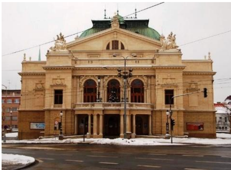
Рисунок 7 – Муниципальный театр им. Й. К. Тыла в г. Пльзень