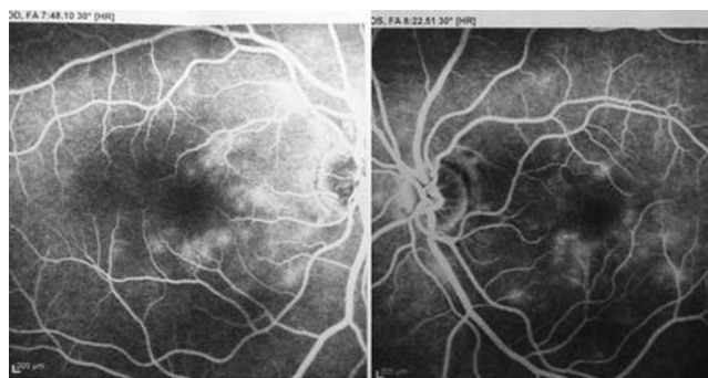
Рис. 3. Ангиографическая картина (поздняя фаза)

29 июля 2010 г. острота зрения: OD sph -0,75=1,0; OS sph -0,75=0,8. Внутриглазное давление на пневмотонометре OD – 15 мм рт. ст., OS – 8 мм рт. ст.