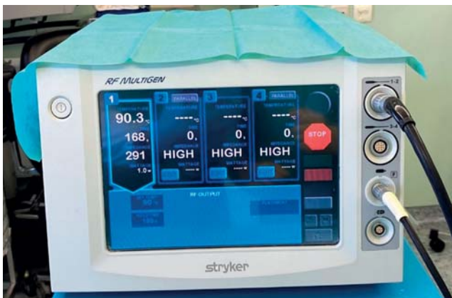
Рис. 3. Радиочастотный генератор Stryker Interventional spine MultiGen RF Console (США).

Вместе с тем, согласно данным иностранных источников, лучшие результаты в контексте эффективности и безопасности с оценкой по ВАШ, Harris Hip Score, WOMAC, OME, OHS отмечаются