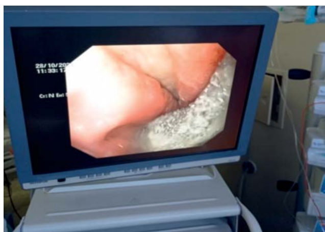
Рис. 2. Эндофото: губка на зонде установлена в области несостоятельности гастроэнтероанастомоза.

Fig. 1. Final stage of the revisional relaparoscopy at gastrojejunostomy leakage after Roux-en-Y gastric bypass: 1 — drains at the leakage zone; 2 — feeding gastrostomy.